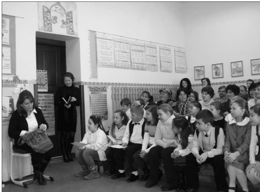
Megérkezett a varázsceruza