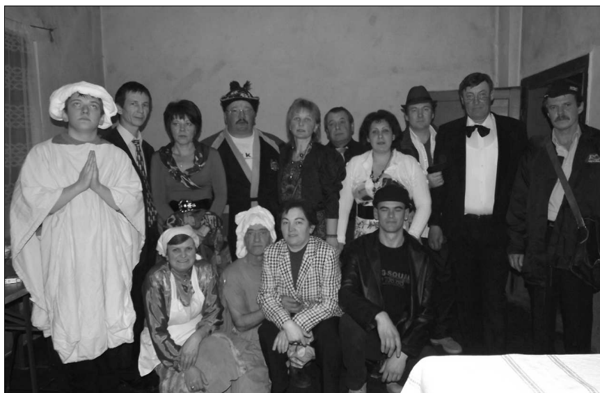
Beresztelki színjátszók