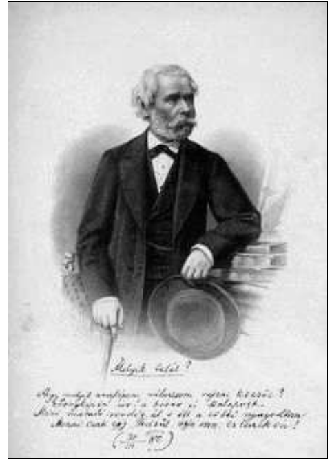
Arany János – Barabás Miklós metszete

1877-ben visszatekint életére, sikereire, kudarcaira az Epilógus című versében. Ebből idézek: „Az életet im megjártam; / Nem azt adott, amit vártam: / Néha többet, / Kérve, kellve, kevesebbet. / Ada címet, bár nem kértem, / S több a hír-név, mint az érdem: /