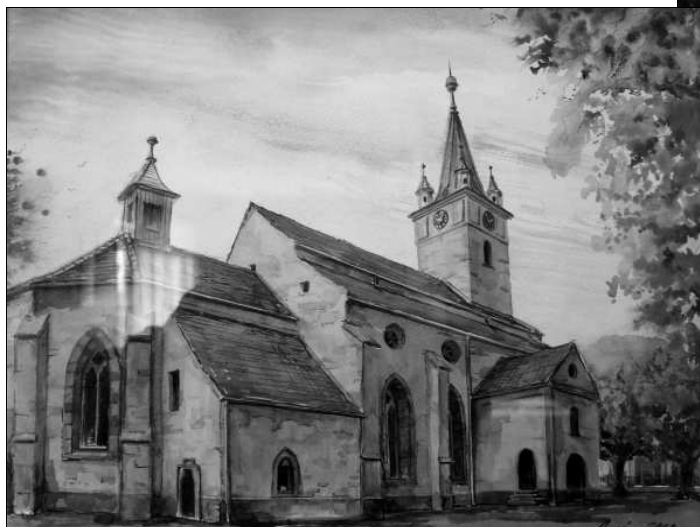
Az evangélikus templom

– Élni és festeni számomra ez egy és ugyanaz. A művészetem által megpróbálom közvetíteni, megérteni a világot, amelyben élek. A vonal és a szín segítségével szeretném közvetíteni az érzéseket, a valóságos emberi élet sorsait, konkrét történeteit, amit az emberi test elvisel, mondjuk fájdalmat, éhséget, félelmet, rémületet, de ugyanakkor az örömet, szeretetet és reményt is – vallja a művész.