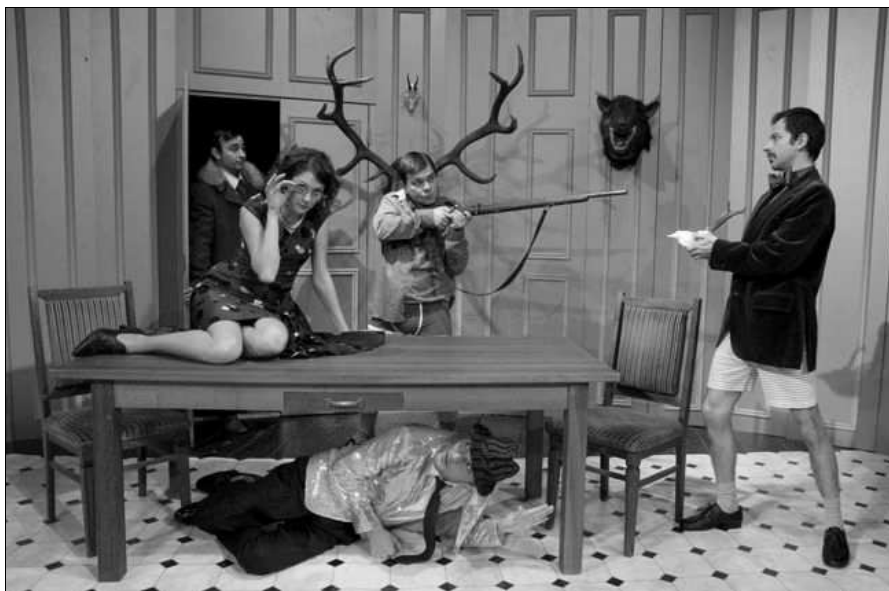
Az úr vadászni jár

A Szászrégeni Polgármesteri Hivatal idén is pályázatot hirdetett a törvény által elismert egyházaknak.