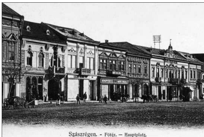
Szászrégen. – Főtér. – Hauptplatz.