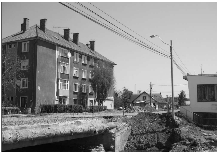
Felújítják a Malomárkon átvetelő hidat

Forgalomelterelésre és forgalomkorlátozásra kerül sor a Postarét –