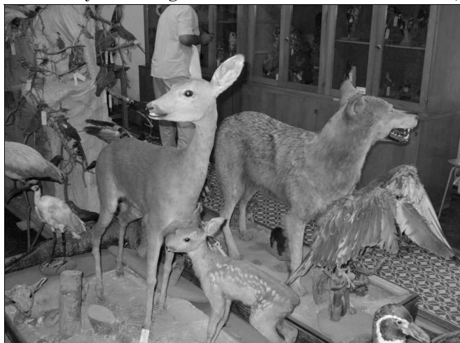
Békésen megférnek egymás mellett