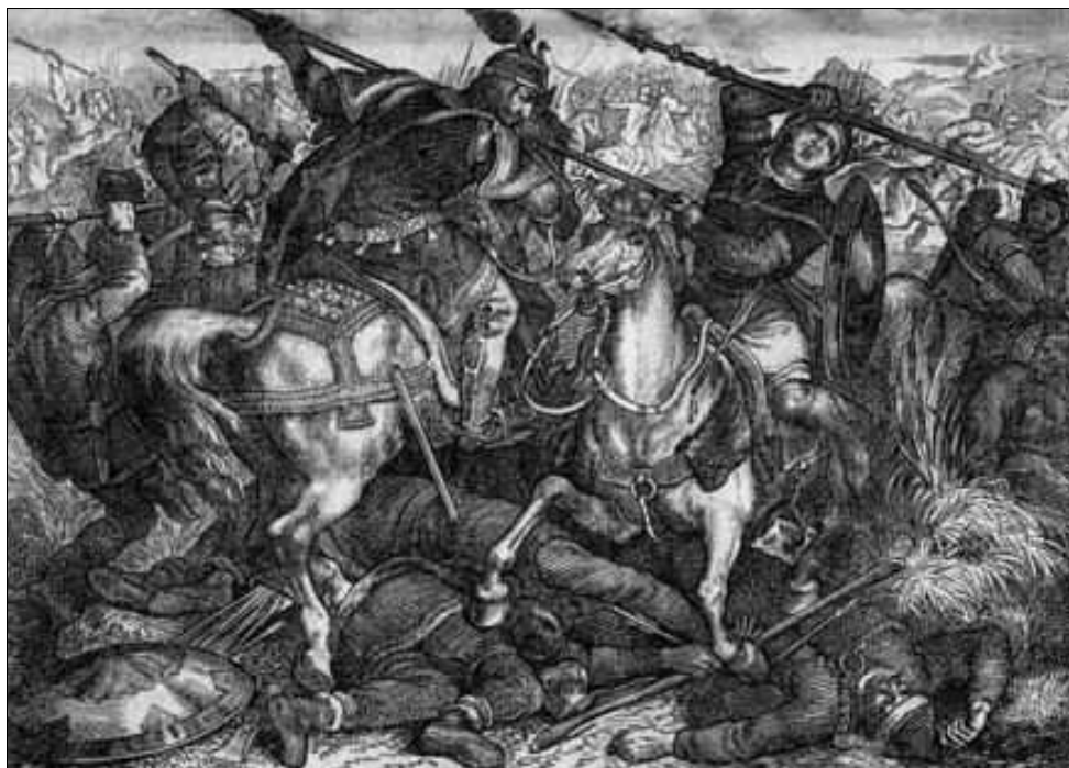
Szent László és a kunok