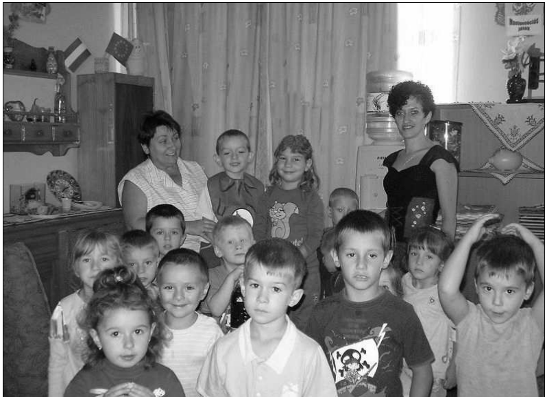
Pusziljuk az anyukákat

Miért szereted édesanyádat, nagymamádat? Mit