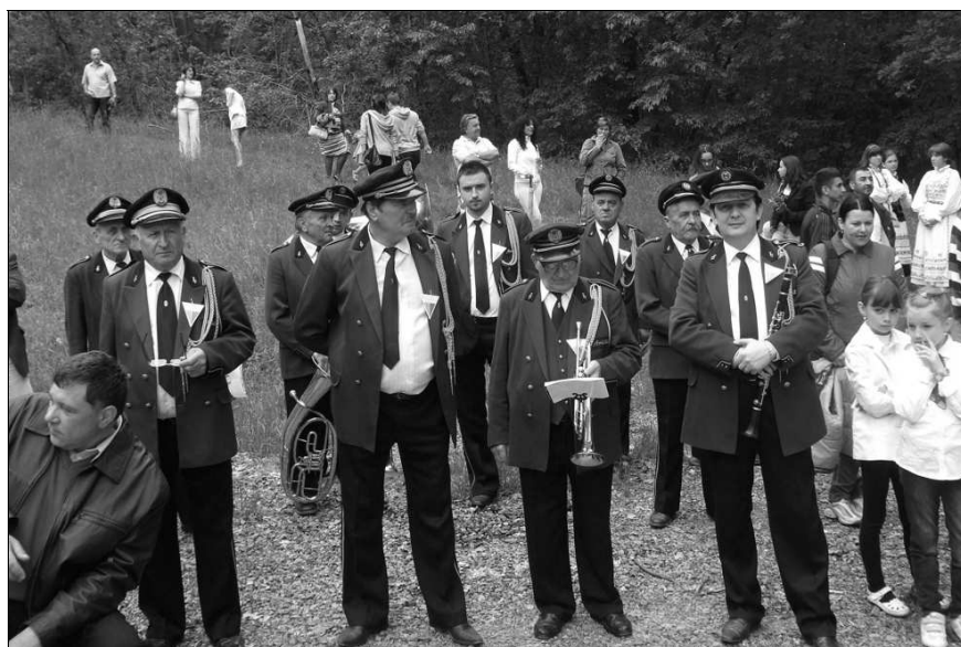
A 2012-es Maifesten

A zenekar minden tagjának köszönjük a fáradtságot nem ismerő munkát és további sikert kívánunk mindannyiunktak!