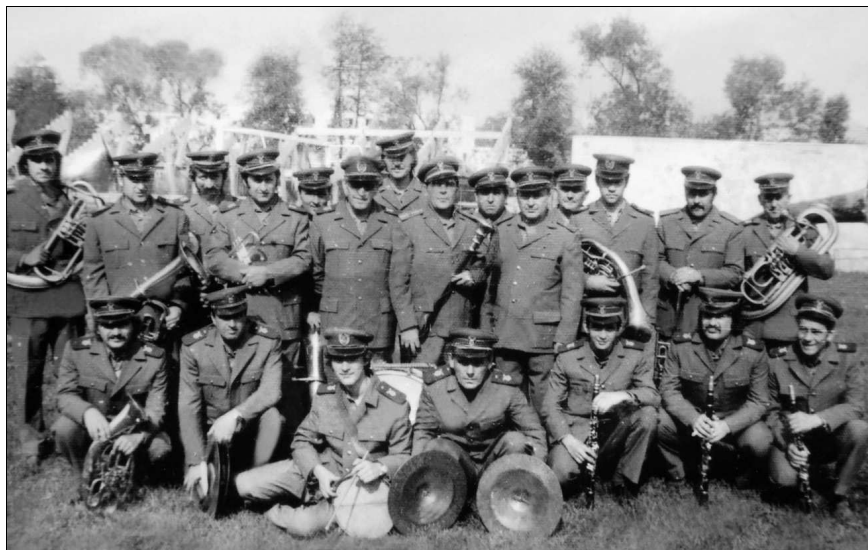
Szászrégeni fúvósok – 1973