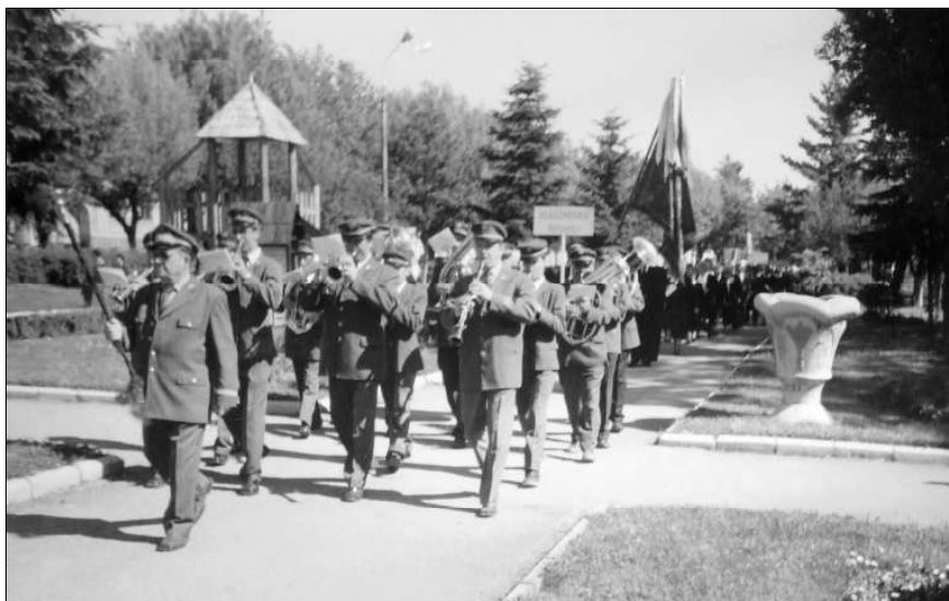
Zengjen hálaének 2007-ben

– A zene szeretete, a folytonosság, a 70 éves zenekar tisztelete. Nem tudnék nélküle meglenni. És nem utolsó-