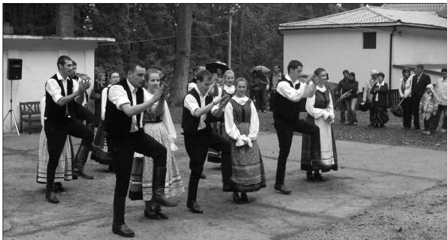
A Kerekerdő néptáncsoport

A kerekerdői színpadon a szászrégeni német óvodás és középiskolás csoportok mellett fellépett a marosvásárhelyi Friedrich Schiller Gimnázium és a Papiu Ilarian líceum német néptáncsoportja, a batosi Rozenkranz, Besztercéről a Regenbogen táncsoport