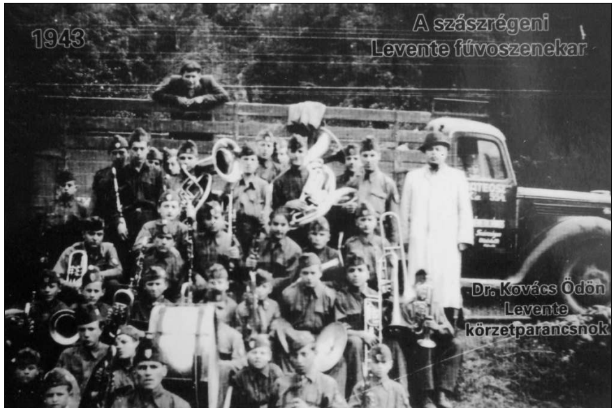
Levente-fúvószenekar – 1943