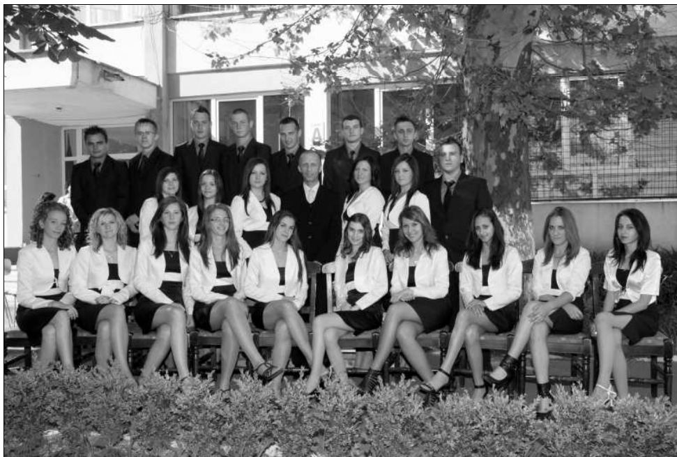
Lucian Blaga Iskolaközpont, Sükösd Levente osztálya

És szóljak arról is, amit tovább kellene vinnetek és át kellene adnotok. Talán az egyik utolsó házi feladat: a felelősség . Gyakran hangzik el a kérdés: édes fiam, te mit tettél, mit fogsz tenni, hogy a világunk szebb és jobb legyen?