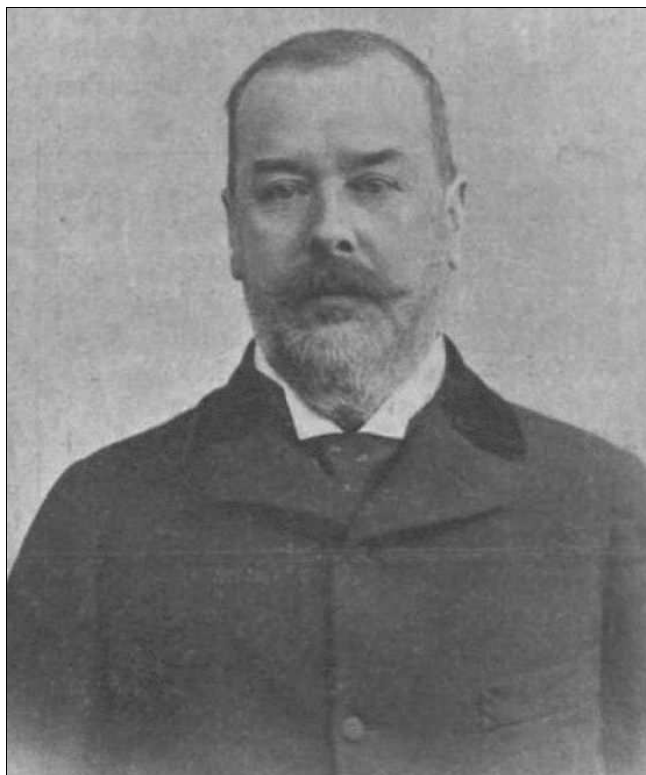
Széchenyi Béla gróf

Az expedícióról húsz hazai és külföldi szakember bevonásával elkészült a Gróf Széchenyi Béla kelet-ázsiai utazásának (1877-1880) tudományos eredményei című háromkötetes munka magyar és német nyelven. Egy 32 lapból álló atlaszt is kiadtak az első kötetkor, mely a térszíni és a geológiai állapotokat tünteti fel. A második kötetben Bálint Gábor a dravida