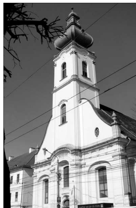
A kolozsvári unitárius templom