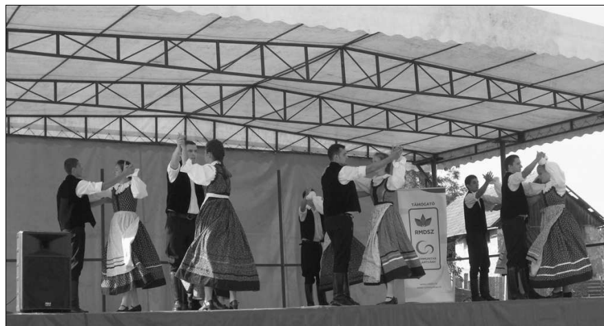
A Kerekerdő Palatkán

A szászföldi Humana Regun Egyesület a Szászföldi Kerekerdő és Rügyecskék néptánc-csoportok kiszállásának támogatása 2012-ben nevű pályázat által megnyert összeget a célnak megfelelően, a tánc-csoportok kiszállásainak anyagi fedezetére használta fel. A szászföldiek részt vettek a VI. magyarpalatkai falu- és néptánc-találkozón (Kerekerdő – július 22.), a XV. vajdaszentiványi tánc-tábor keretében rendezett néptáncesten (Kerekerdő – augusztus 1.), a XVII. Holtmarosi Gyöngykoszorú találkozón (Kerekerdő és Rügyecskék – augusztus 12.). A csoportok nevében ezúton mondunk köszönetet a