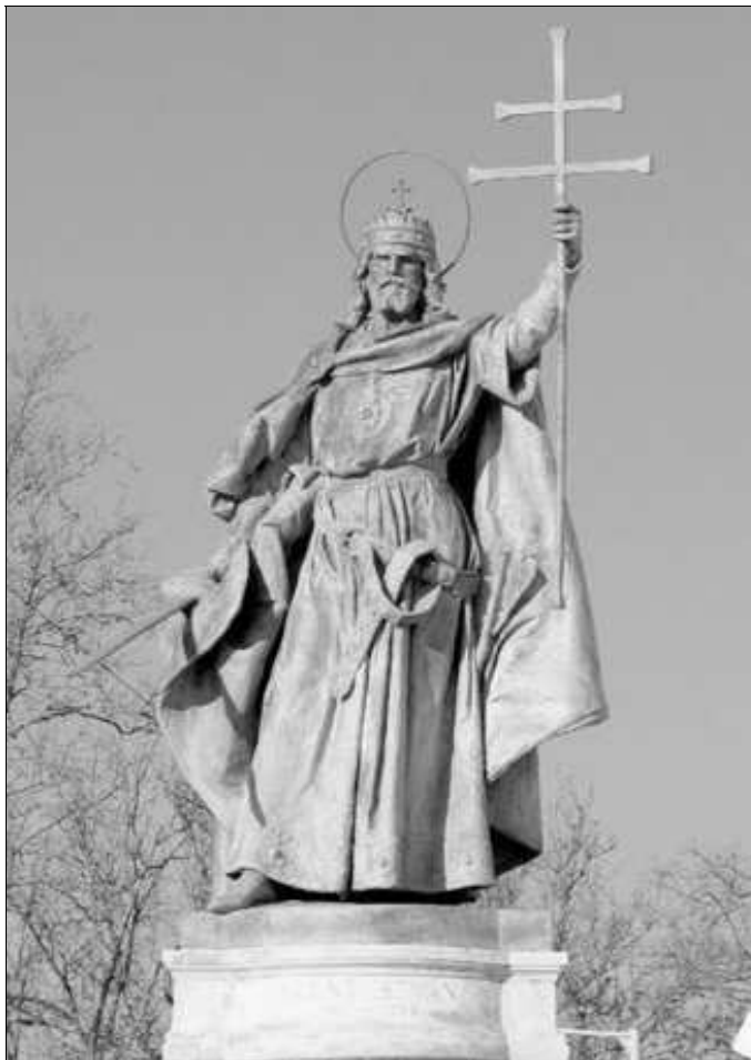
Szent István a Hősök terén

Nemzeti ünnepünknek, amikor remélhetőleg majd újra egyszerre dobban a nemzet szíve, legyen ez a fohász a legszebb és legmaradandóbb üzenete.