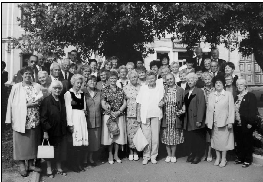
2002-ben, az 50 éves találkozón