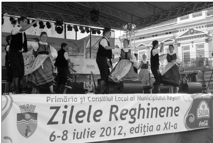
A Kerekdő a városnapokon

A nagy hőség és az esti tumultus ellenére mindenki található szórakozási lehetőséget.