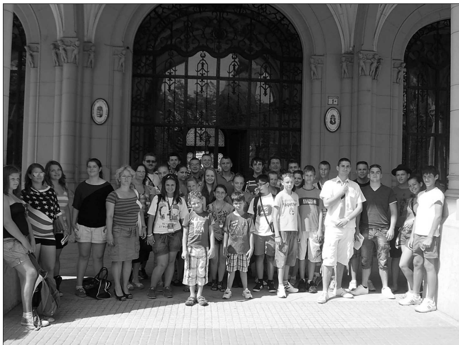
A Rügyecskék táncosai

Az ott töltött nyolc nap alatt a szervezők sok különleges élményt biztosítottak nekünk, kicsiknek és nagyoknak. Volt ott minden: séta, városnézés, strandolás, koncert, táncház, családi délutánok, lovasbe-