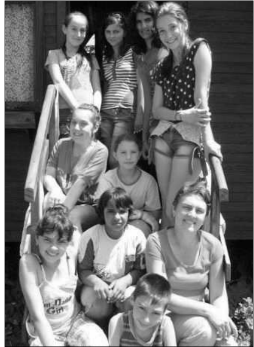
Együtt a régiek

Nagyon sok élményben volt részünk, sok emberrel megismertünk, sok-sok mosolygó arcot