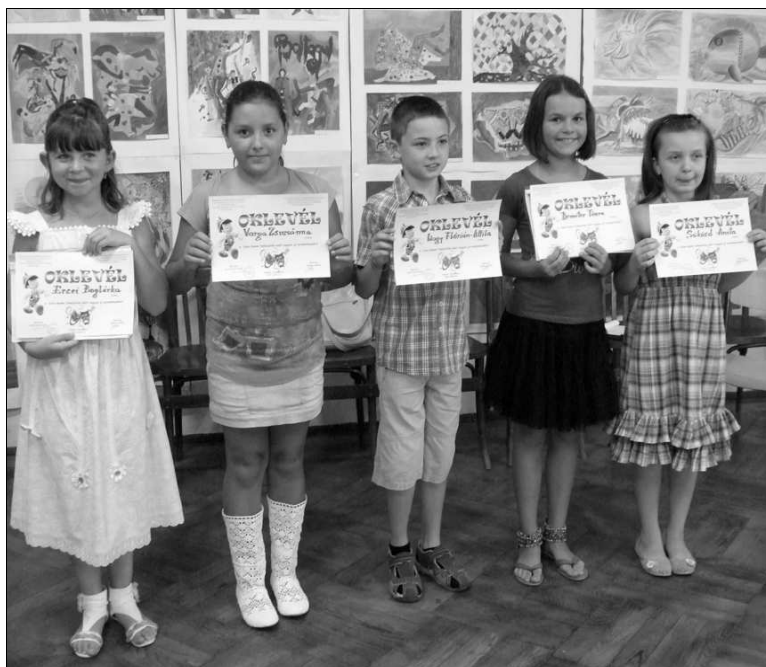
A legkisebb csim-bummosok

A szászrégeni Eugen Nicoară Művelődési Ház keretében tevékenykedő Csim-Bumm Ifjúsági és Gyermekek Színjátszó Csoport új tagokat toborzott a gyerekcsoportba.