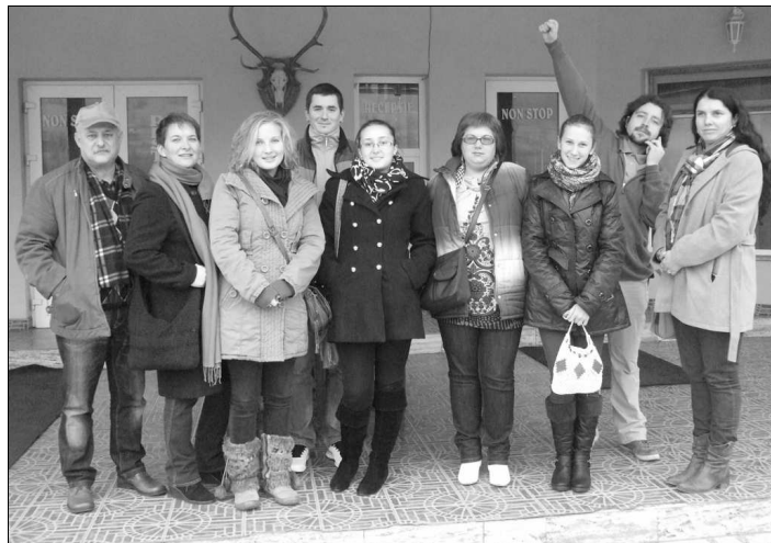
A Szászrégeni Népszínház