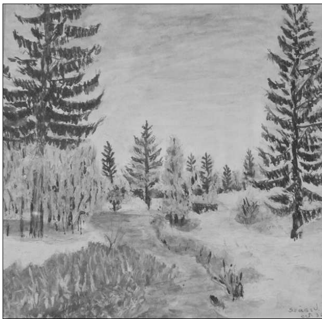
Szász V. – Téli táj

volt iskolájuk, mivel a báró az olcsó munkaerő miatt sok románt telepített be, akik idővel elszaporodnak. Napjainkban is a kereszt alakú elrendezésű település jelzi, hogy a református templom a falu felső részén épült, közelébe iskola és kántorlak, valamint a kultúrház – itt lehetett valamikor a falu központja. A falu