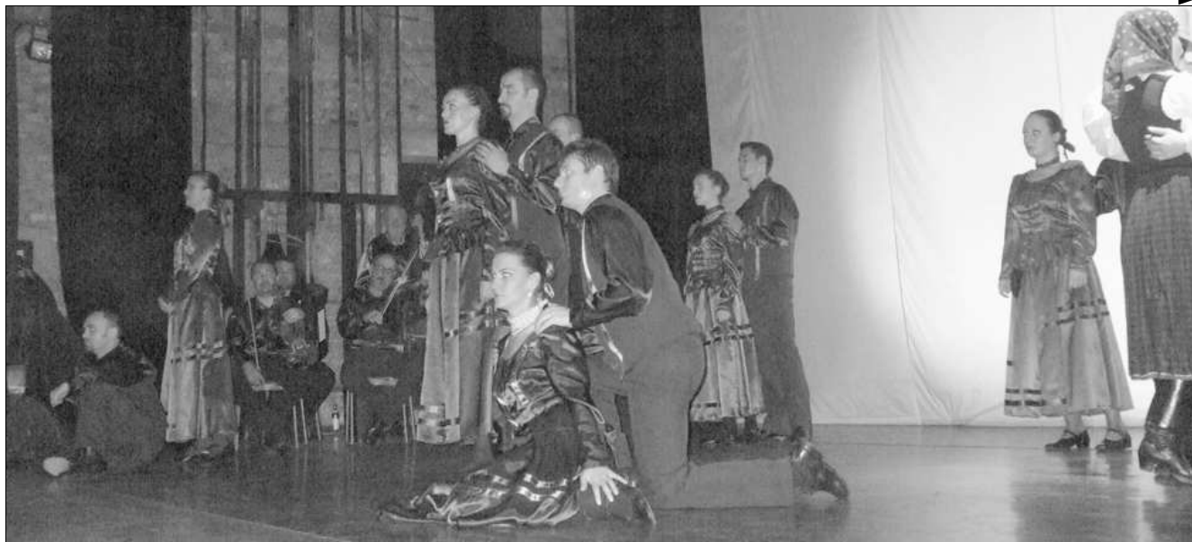
A Maros Művészegyüttes

Új székhelyre költözött a szászrégeni rendőrség. Az új székhely az Egyesülés negyedben, az 57-es szám alatt levő 120 lakrészes tömbház földszinti részén van. A költözés nem befolyásolta a rendőrség programját. Ezentúl is 24 órás szolgálatot teljesítenek. Ami a hatósági erkölcsi bizonyítványok – certificat