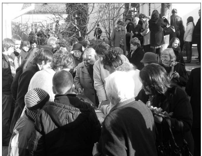
Adventi vásár Magyarrégenben