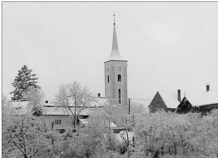
A magyarrégeni református templom