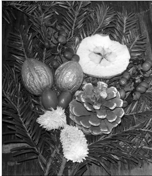
A Koós Ferenc cserkészcsapat munkája 1.

A helytelen készülés jelei: a képmutatás, az önámítás és a tévhit. Mindhárom az olaj nélküli lámpásokra emlékeztet, és az önmagával elégedett keresztyénre mutat.