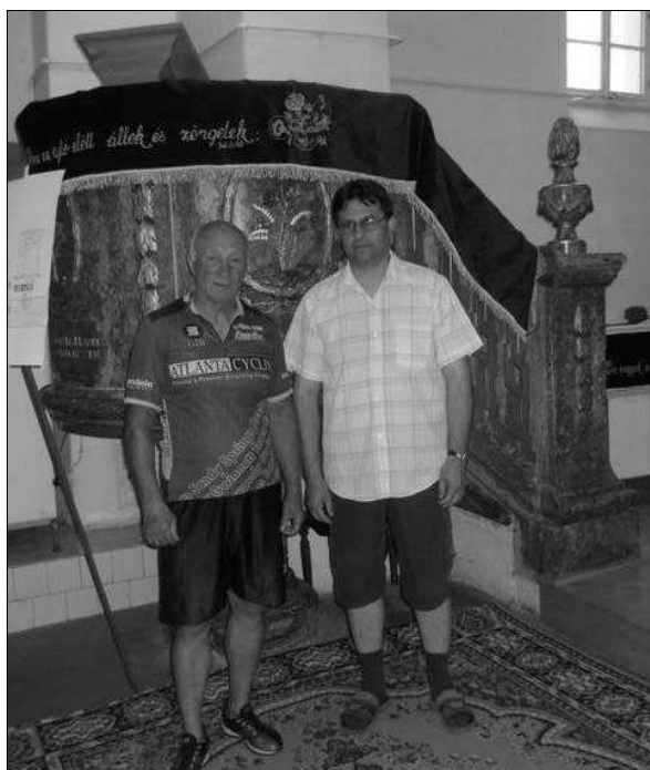
A beresztelki templomban

Június 26-án késő délután különleges meglepetésben volt részünk, amikor a híres világutazó, Lezhava Jumber bekopogott a beresztelki parókiára, és szállást kért egy éjszakára.