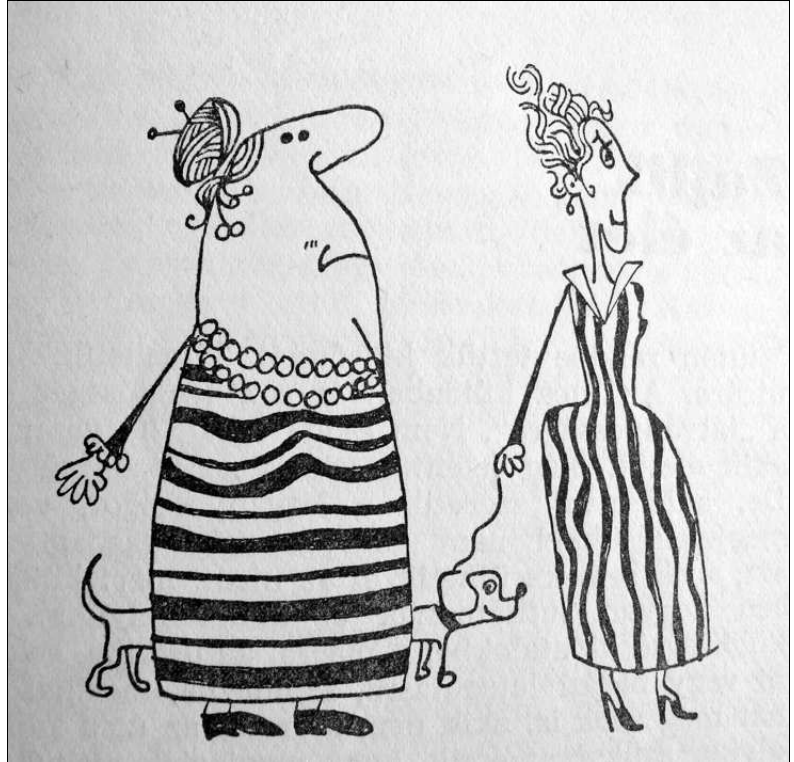
Kisgyörgy Tamás rajza

Hivatalokban különösen visszatásító mind az elhanyagolt, mind a túlcicomázott, választékosan elegáns öltözködés. Az ilyesmi nem váltja ki az ügyfél