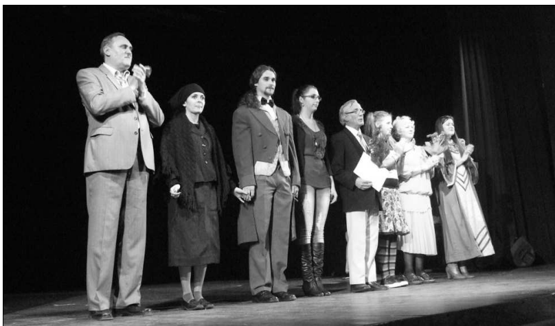
A gyergyószentmiklósi Fábíán Ferenc Színtársulat

A Szászrégeni Népszínház Kemény János Társulatának utazási költségeit a Communitas Alapítvány és az RMDSZ biztosította.