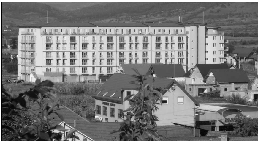
A rendőrség új székhelye

Szászrégen Polgármesteri Hivatala ebben az esztendőben is megszervezte a hagyományos téli