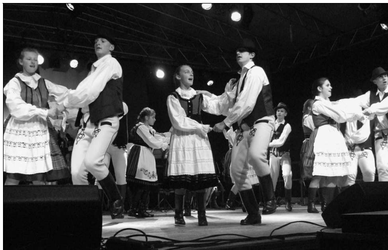
A Rügyecskék néptánc csoport

November 27–29-e között került sor a XXXIII. Könyvtári Napok rendezvénysorozatára Szászrégenben. Ekkor nyitották meg az Ifjúsági Ház épületében a gyermekrészeleg új székhelyét, valamint az Információs Központot és a Biblionet szolgáltatást. Sor került Marcel Naste modern festészeti tárlatnyitójára. A könyvtári napok keretében a magyar ajkú olvasóknak is bemutatták az Információs Központot, az új gyermekrészelegét és a Biblionet szolgáltatást.