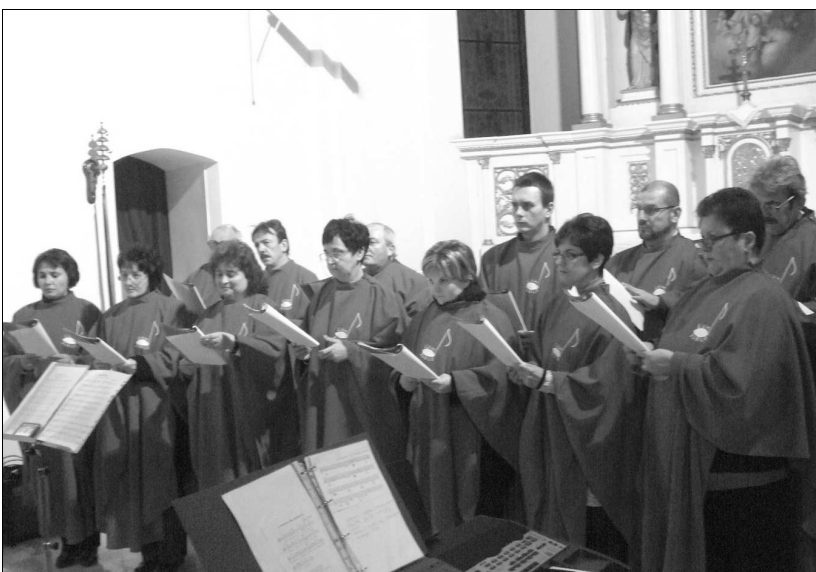
A Cum Jubilo kórus

Az utóbbi évek hagyományához híven tavaly is sor került Szászrégenben a magyar történelmi egyházak adventi kórustalálkozására. Ezúttal a rendezvény házigazdája a római katolikus egyházközség volt.