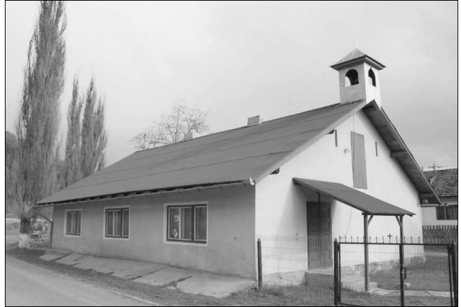
A galócási református templom

1958-ban a katolikus kápolna épületének egyik felét átengedték a református közösségnek.