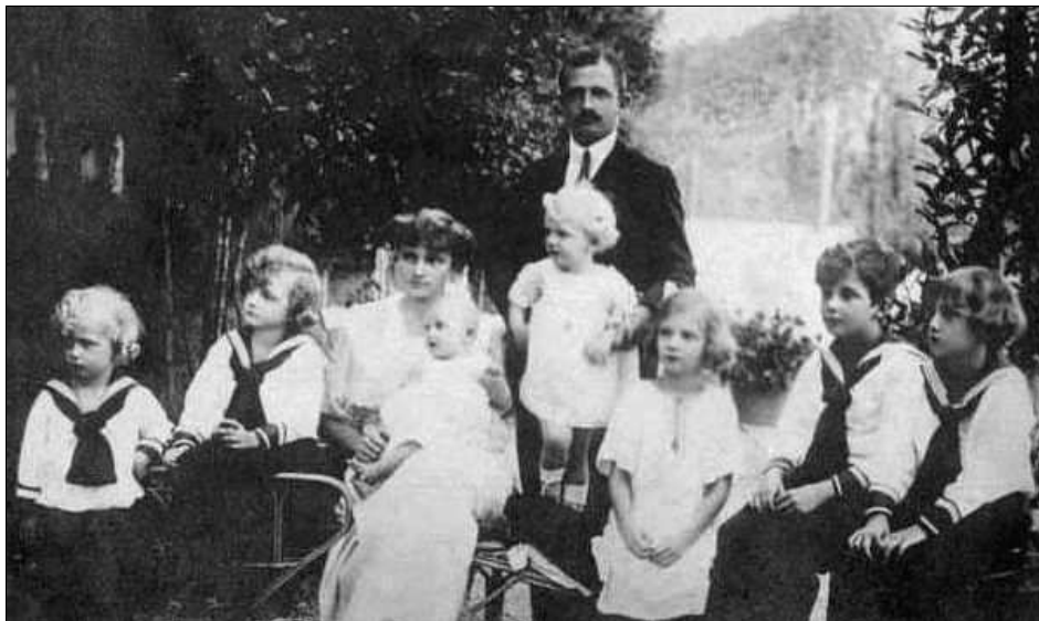
IV. Károly és családja

1919 nyarától Horthy Miklós presztízse emelkedett, hová ismertsége is nőtt. Formálódni kezdett valamilyen erő, amely ha nem is a régi rendet akarta visszaállítani – a császári monarchiáról már nem lehetett szó –, de valamiféle rendet akart, megszüntetni a rémuralmat. Jártta az országot, és a nemzeti kormány megbízottjaként (védelmi miniszter, a hadsereg parancsnoka volt) tárgyalta a szövetséges erők katonai vezetőivel. Ő a mérsékelttek közé számított, nem volt annyira elvakultan jobbos, mint jó néhány miniszter társa. A proletárdiktatúra időszakában az ál-