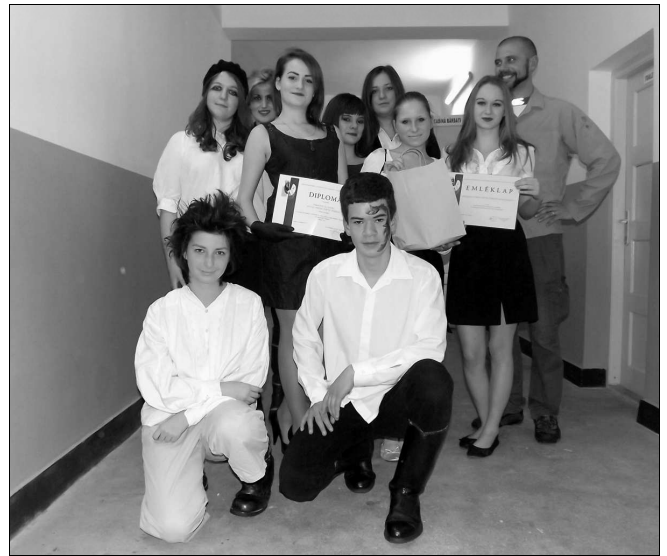
A Dávid Ferenc Ifjúsági Egylet

Ebben az idényben egy történelmi játékot adtak