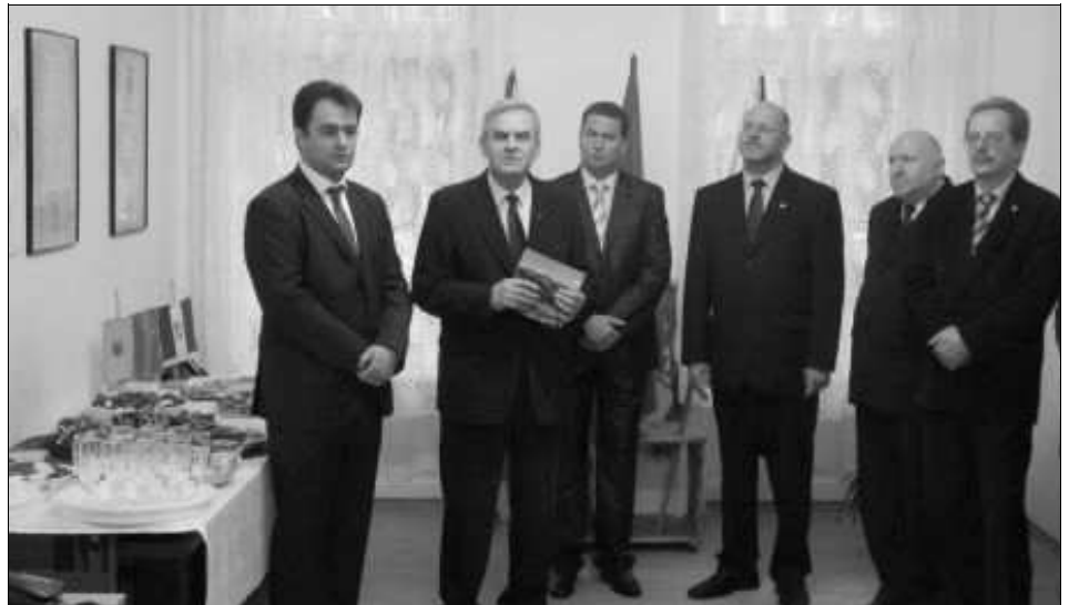
A megnyitón