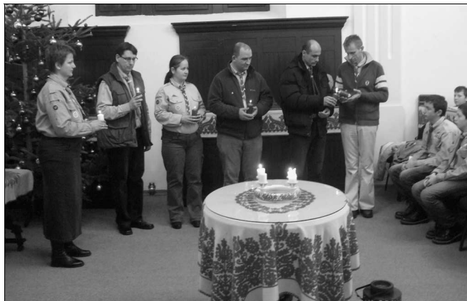
Átadták a lángot

(Magyar Hunor – A Görgényi Református Egyházmegye templomai)