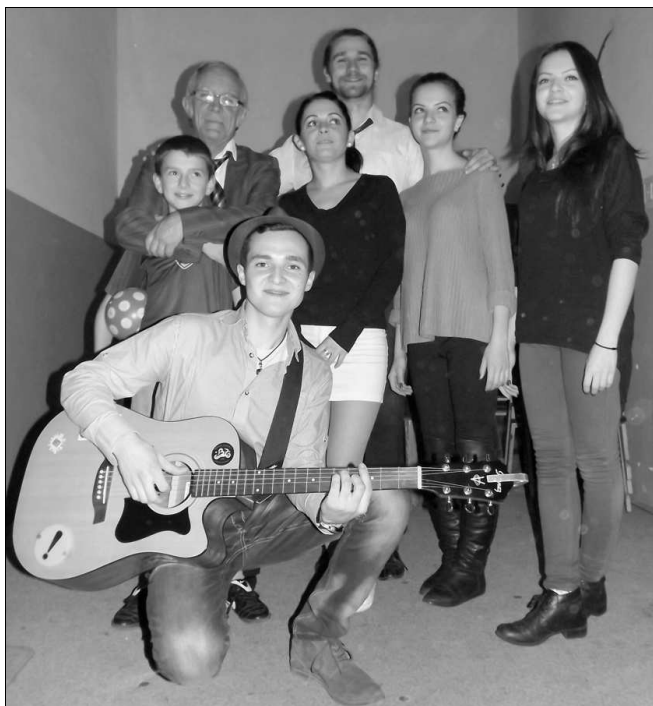
A Fábíán Ferenc Társulat