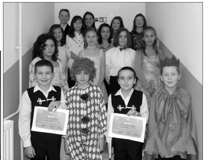
A Csim-Bumm csoport