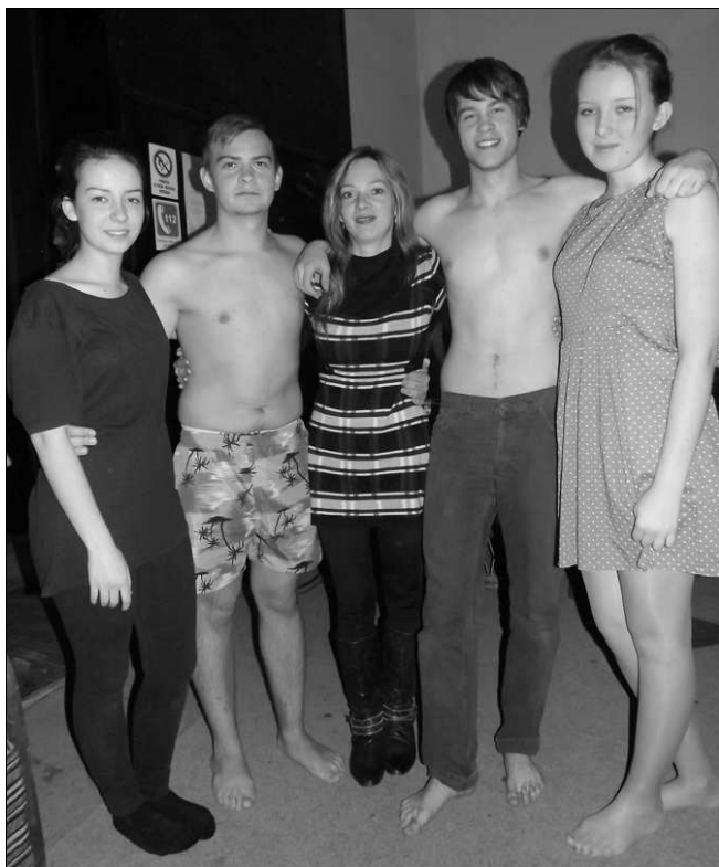
A Bodor Péter Színkör a Woyzeckben