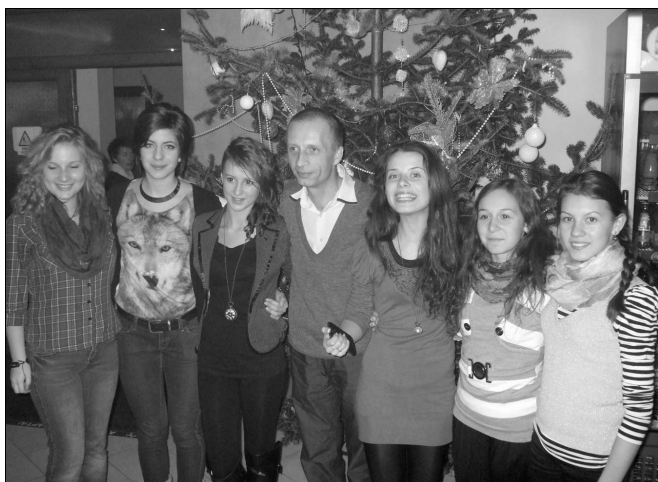
A Fantázia csoport