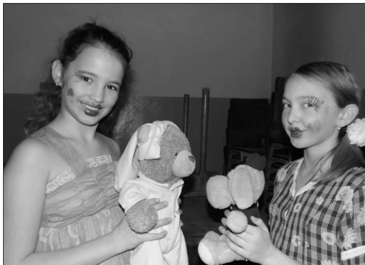
Az erdőszentgyörgyi Babák

Novemberben a Gyergyószentmiklóson megrendezett XXI. MŰSZIT-en – műkedvelő színjátszók találkozója – ünnepelték a társulat 35. születésnapját. Ebből az alkalomból egészséget, munka-