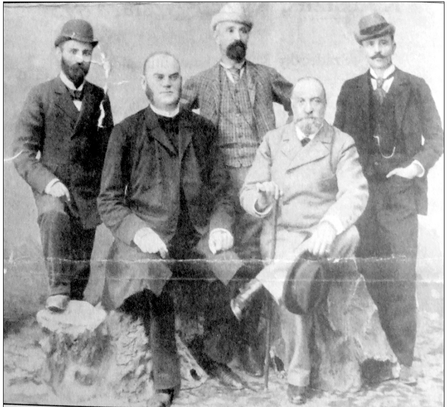
Az expedíció tagjai

A székely történelmi pályadíjalap intézőbizottsága Szabó Károly halála után, 1892 novemberében Szádeczkyt bízta meg a székelyek történetének megírásával. 1893 jú-