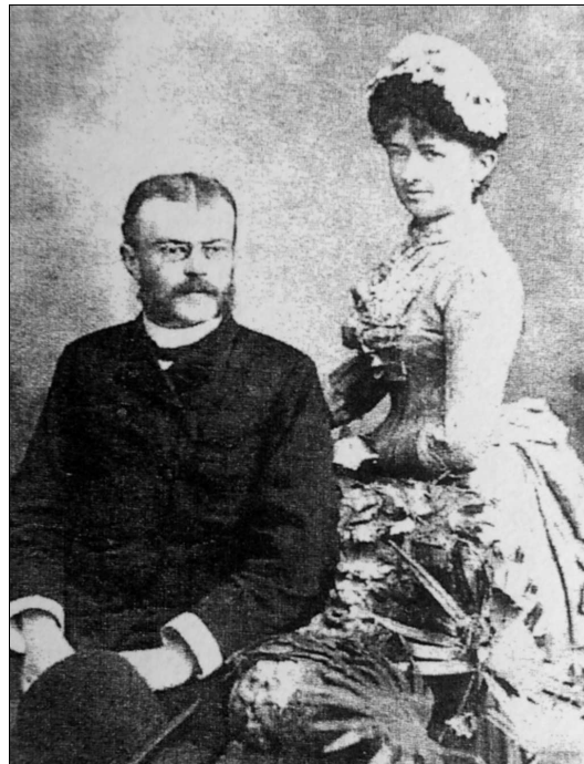
A boldog pár