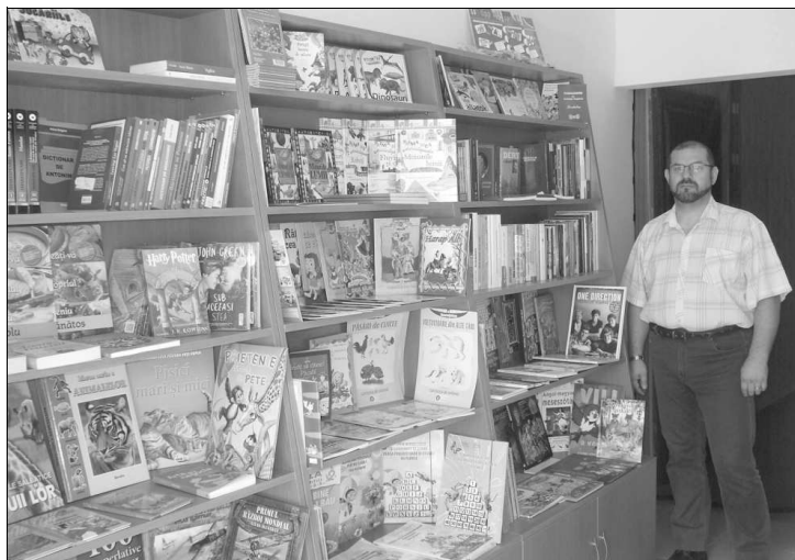
Nagy a választék

– Az üzlet kínálata három részre osztható. Első a könyveladás. Magyar és román nyelvű szórakoztató irodalom, tudományos, képes-kifestős, iskolai szemléltető könyveket árusítunk. A második a tanfelszerelések kategóriája – írószer, füzet, táska stb. –, és irodai felszerelések is kaphatók. A harmadik az ajándék- és népművészeti tárgyak kategóriája, melyek egy részét saját kezűleg készítem, más részüket korondi kézművesektől szerzem be – nyilatkozta lapunknak a tulajdonos.