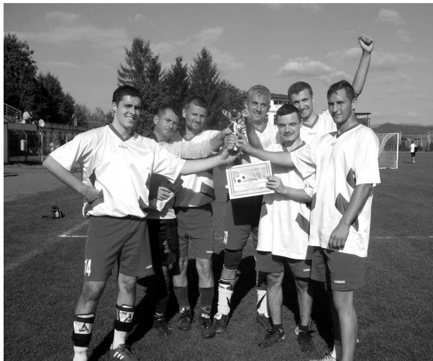
Csokonai Vitéz Mihály – a boldog győztesek

A kisdöntőben a Bikák csapata 8-0-ra lehengette a magyarrégenieket. A döntőben, megérdemelten, a Csokonai Vitéz Mihály 5-1-re megleckéztette a na-