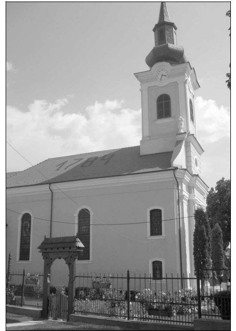
A szászrégeni római katolikus templom