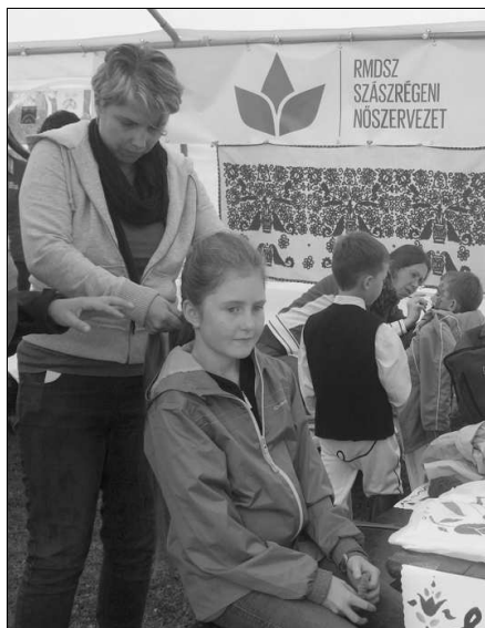
Hajfonás és arcfestés