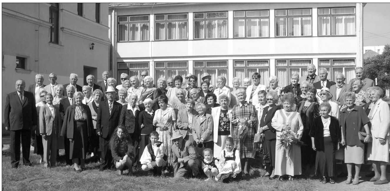
A volt képzősök

A rendezvény már pénteken kezdetét vette. A volt képzősök elhunyt tanáraikra, társaikra a magyarrégeni református temetőben, majd ezt követően a római katolikus templomban tartott szentmisén emlékeztek.