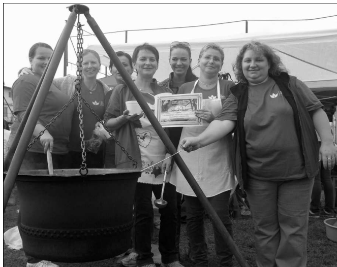
A legeslegeslegnagyobb üst

Biztató, hogy a tavalyinál több és nagyobb bográcsokban rotyogott a többféle hús, de volt ott gomba, bab, csipetke is, nem is beszélve a fűszerekről. Egyes csapatok az alkalomhoz illően beöltöztek, mások feldíszített sátrak előtt várták a betérőket, a „Bujdosó székelyek” halászlével csalogatták a vándort. A Nemes Árpád által vezetett zsűrinek nem volt könnyű dolga. De nem is a helyezések a fontosak, hanem a részvétel, a jókedv, az együttlét, a sok-sok mosolygó ember és természetesen a pohárka kisüsti mellett elfogyasztott finom gulyás.