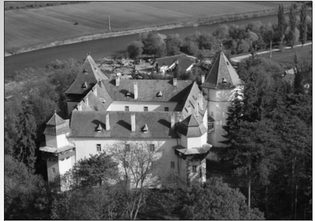
A marosvécsi kastély

Kemény János báró leszármazottai 2014. szeptember 23-án birtokba vették a marosvécsi kastélyt, amelyben az erdélyi helikoni írói közösség alakult és tartotta éves találkozóit. Az impozáns épületben államosítása óta neuropszichiátriai rehabilitációs központ működött. Az intézmény számára az Európai Unió támogatásával építettek új épületegyüttest a településen, az elmúlt napokban költöztették át a betegeket. Az intézmény további egy hónap haladékot kapott az épület teljes kiürítésére. A család ezután kíván dönteni a meglehetősen jó állapotban fennmaradt várkastély rendeltetéséről.