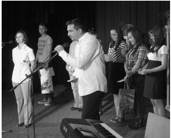
A díjazás a gálaesten történt