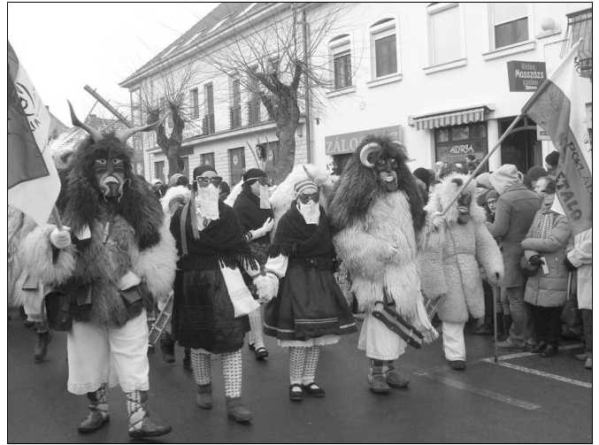
A mohácsi busójárás

A húshagyókedd a farsang és egyben a farsang farkának utolsó napja. A farsangtemetés időpontja. Ezen a napon általában szalmabábut vagy koporsót égettek, jelképesen lezárták a farsangot és a telet.