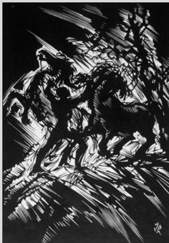
lmetz László metszete