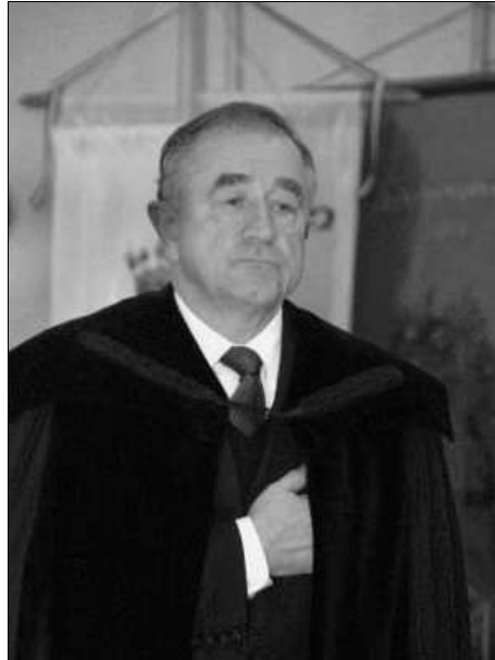
Bálint Benczédi Ferenc püspök

tagjainak száma Erdélyben 65 ezerre, Magyarországon pedig hat-ezerre tehető.