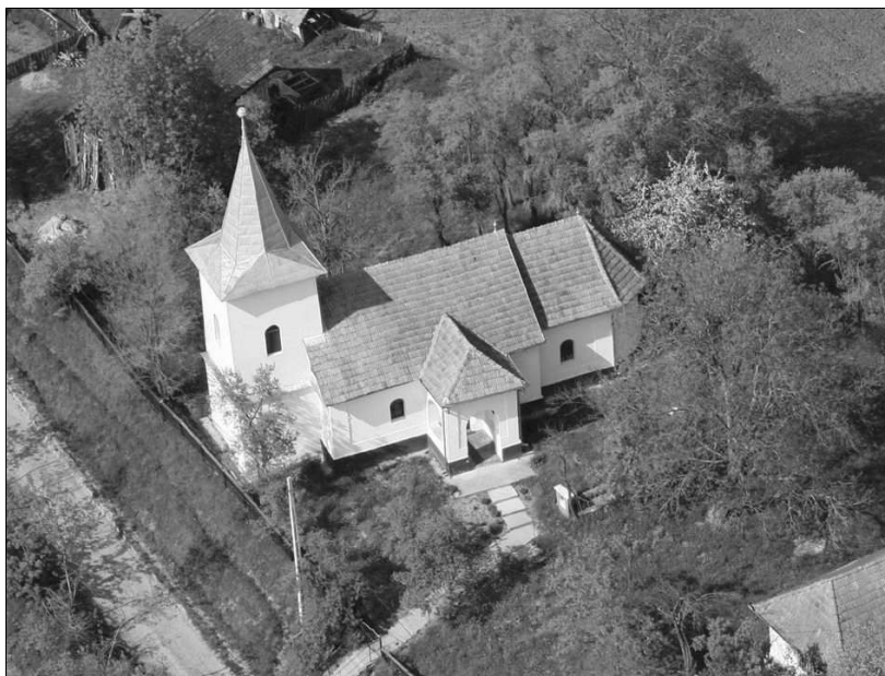
A komlói református templom

Ma a Mezőörményesi Református Missziós Egyházközösséghez tartozik Mezőörményes, Mezőseptér, Oroszfája mellett. E négy gyülekezet csupán az 1970-