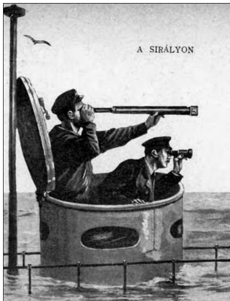
A Sirály naszád