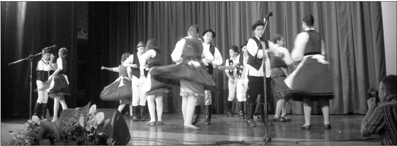
A Petru Maior líceum néptáncosai