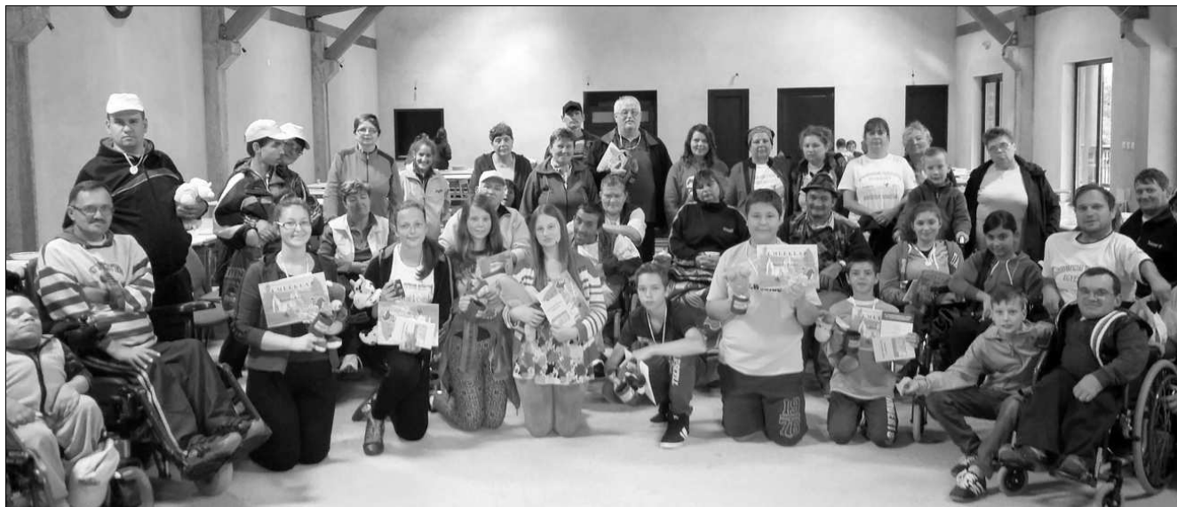
Gondozók és gondozottak

A tiszteletes úr az egyik IKE-órán azzal állt elő, hogy részt fogunk venni egy kerekesszékes, keresztyén lovas táborban. Egy kicsit mindenkit sokkolt a hír, de volt aki elfogadta és jelentkezett, és volt aki nem, az itthon maradván kimaradt egy felejthetetlen, élményekkel teli akadálymentesítő, érzékenyítő táborból.