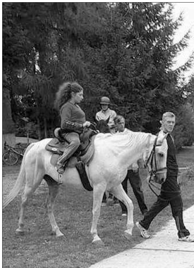
Gyí te Paci!