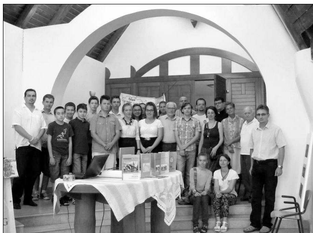
A versenyzők, a zsűri és a résztvevők