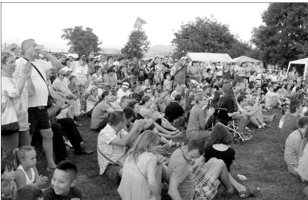
Kezdődhet a koncert