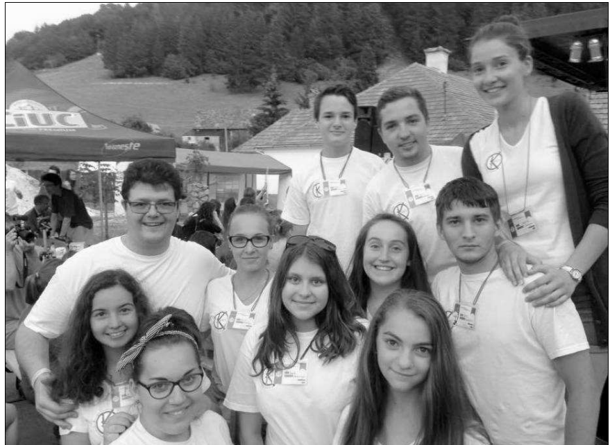
A szászrégeni KVICS