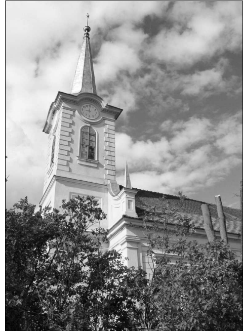
A radnótfáji nagytemplom

Földiek, barátaim, akik együtt indultunk s érkezünk ide, akik hidat építettünk a múlt és a jövő között, habár arcunk barázdált, hajunk őszes, mégis arra kérlek, hogy ennek a hídnak a pilléreibé építsük be azt, amit a múltból a jövőbe átvinni érdemes: a szeretetet és az összefogást. Szeretni meg annyit jelent, mint örülni mások boldogságának, és mi ezúttal mindannyian nagyon boldogok voltunk. Merjünk tehát továbbra is közösen nagyot álmodni, hogy önbizalommal, aka-