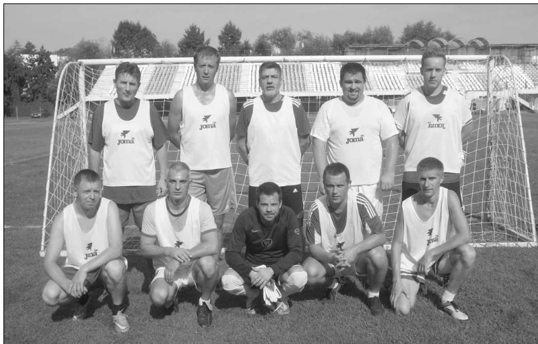
A bajnok csapat

Néhány mérkőzés eredménye: Kerekerdő – Magyarrégen 1-3, Radnai Szomjas Bikák – Dallas Cowboys 1-2, Pedagógusok – Magyarrégen 1-3, Magyarrégen – Vitéz Mihály 1-1. A magyarrégeni gárda sikere teljesen megérdemelt és vitathatatlan. A