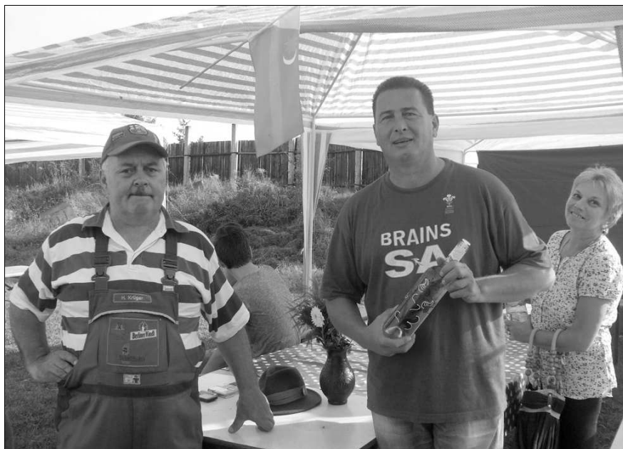
Házi titok jó szívvel – a nyertes csapat