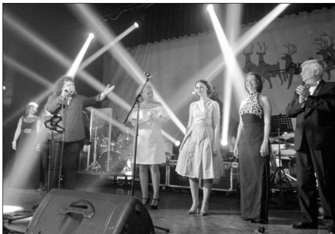
Karácsonyi Titán koncert

A rendezvénysorozat keretében a szászrégeni RMDSZ Nőszervezete a Csillag Egyesülettel közösen szervezett adventi jótékonyági vásárt az Eugen Nicoară művelődési házban, ahol közreműködött a Pici Sófár – a szászrégeni református egyházközség