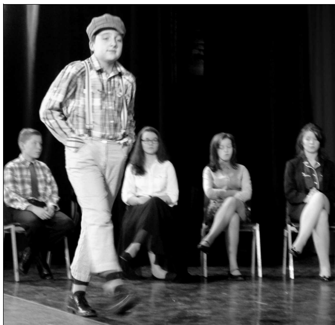
Csim-Bumm: Adjátok vissza az iskolapénzt

A Mini Csim-Bumm az Eugen Nicoară művelődési ház keretében tevékenykedik. A csoport tavaly júliusban alakult a frissen végzett II. osztályosokból. Azóta már „nagy III. osztályosok” lettek. Eddig két fellépésük volt, legutóbbi az október 6-i emlékestén. A