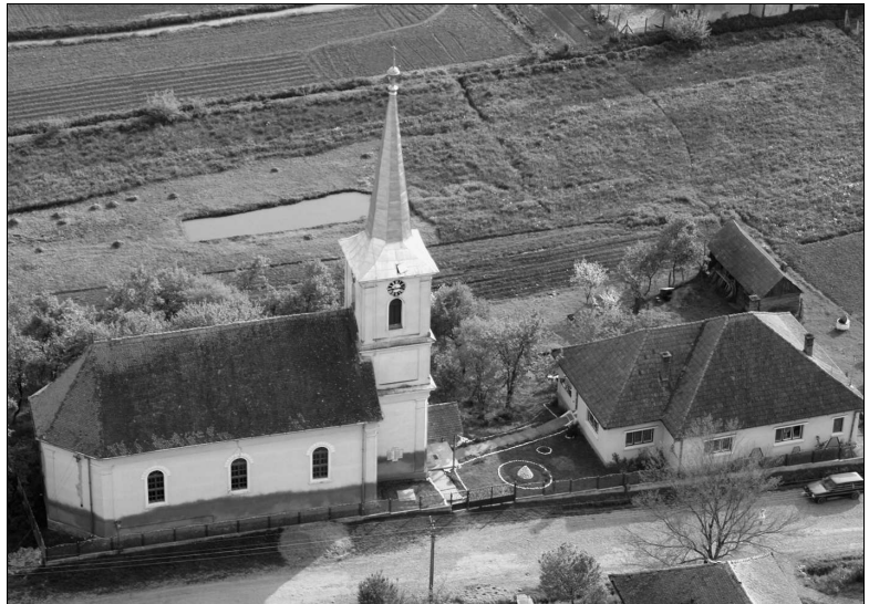
A marosjárai református templom

A mai templom helyén egy 17. századbeli templom állott, melyet 1859-ben lebontottak. A mai templom az 1860-1871-es években épült, a gyülekezet híveinek áldozatkészségéből és munkájával. Kőből és téglából építették, hossza 19 méter, szélessége 9,5 m, magassága 9 m. Az 1870-1871-ben téglából épült tornyot 1893-ig két-