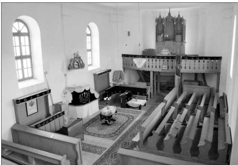
A templom belseje