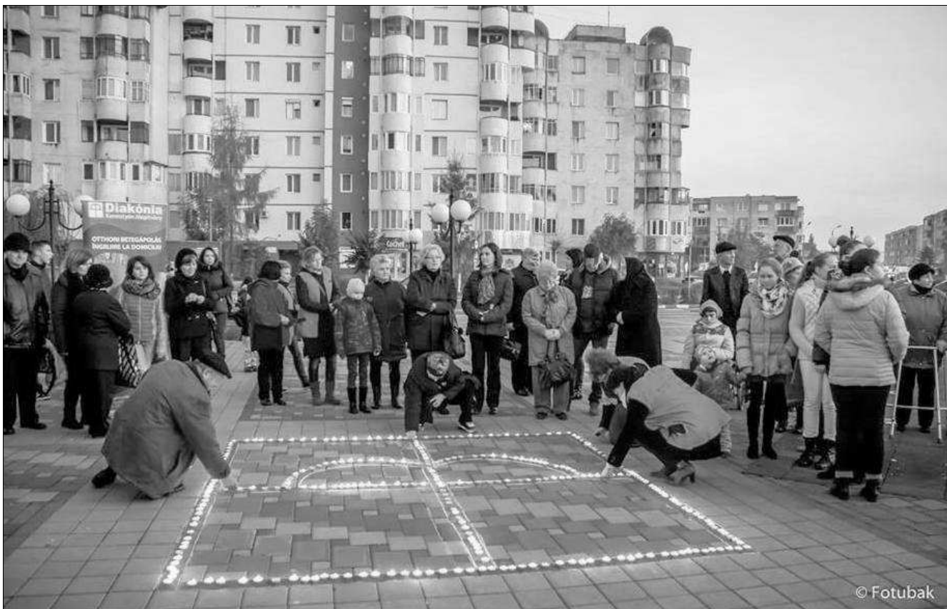
Tízéves a Diakónia

A Diakónia Keresztény Alapítvány, az Erdélyi Református Egyházkerület szeretetszolgálatosa minden évben Katalin-nap környékén szervezi meg a diakóniai munkát végzők szakmai találkozóját, a Bethlen Kata-napokat. Tavaly november 18-án és 19-én a szászrégeni Monte Carlo vendéglátóegység konferenciatermében volt a találkozó, amelyen megünnepezték a szászrégeni szolgálat létrejöttének 10. évfordulóját.