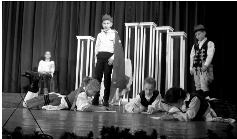
Mini Csim-Bumm: A három örökös

Külön köszönet illeti mindazokat, akik ellátogattak és megtisztelték jelenlétükkel rendezvényeinket. Továbbra is számítunk rájuk. Nélkülük létünk hiábava-