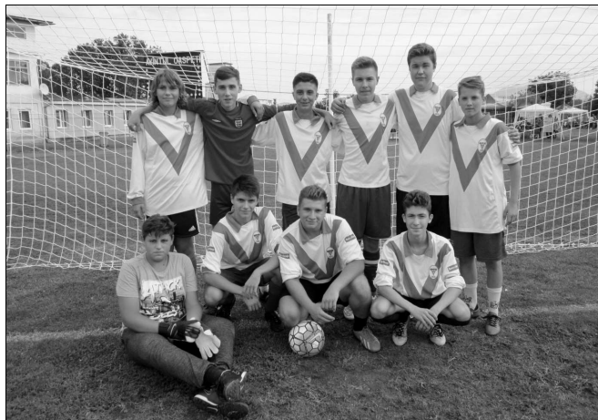
Radnótfája FC VI. hely

Kék Farkasok – Radnótfája 11-0, Radnai Szomjas Bikák – Kurucok 2-3, Kék Farkasok – Radnai Szomjas Bikák 6-3, Radnótfája – Kurucok 1-7, Kék Farkasok – Kurucok 3-1, Radnai Szomjas Bikák –