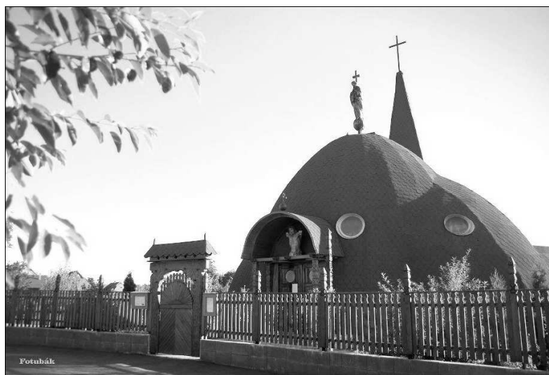
A radnótfáji római katolikus templom