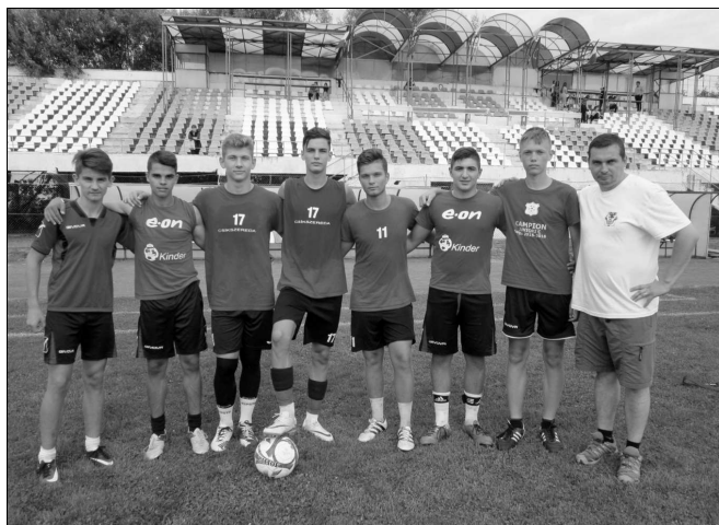
Kurucok IV. hely