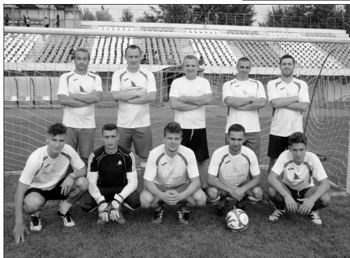
Kék Farkasok II. hely

A Radnótfája FC fiataljai első ízben vettek részt a küzdelemben, s noha az első két találkozón nagyarányú vereséget szenvedtek, derekasan küzdöttek,