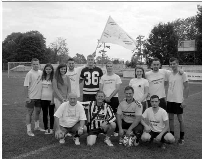
Ismeretlen Arcok III. hely

Radnótfája 3-3. Ismeretlen Arcok – Magyarrégen 1-1, Ismeretlen Arcok – Ifi Steaua 1-2, Ifi Steaua – Magyarrégen 4-1.