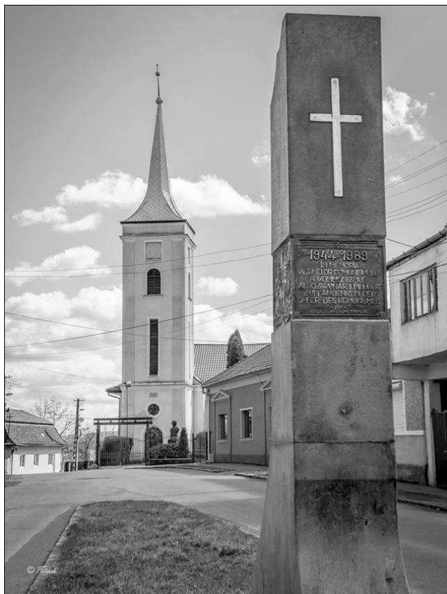
A kommunizmus áldozatainak emlékműve