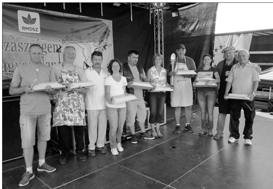
A gulyásfőző verseny díjazottjai