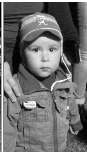
„Jövőre ismét itt leszek”