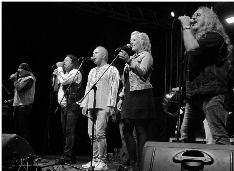
Attila Fiai Társulat

Nem maradt viszont el az Attila Fiai Társulat koncertje. A társulat küldetésének nemzeti rockoperáink élő előadását tartja. Az alapzenekart minden előadásban több neves rockénekes vendégszereplése gazdagítja. A műsorban részleteket hallhattunk többek között az István, a király, a Honfoglalás, az Egri csilla-