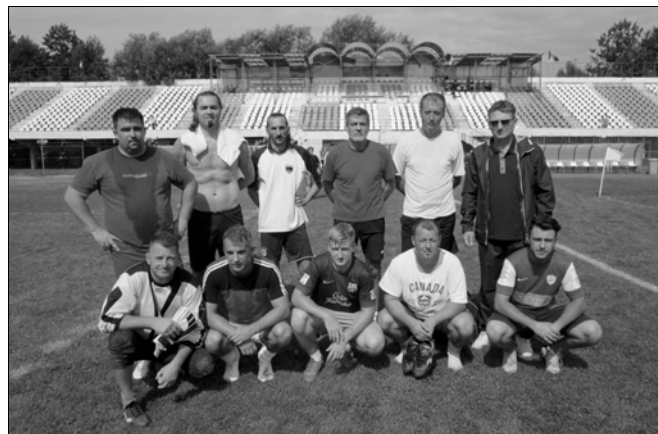
Magyarrégen V. hely

Ezután a helyosztó találkozók következtek, ezek