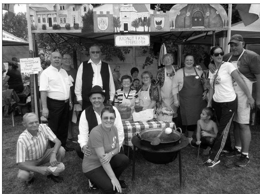
Radnótfáji Kaszások – aranyfakanalások