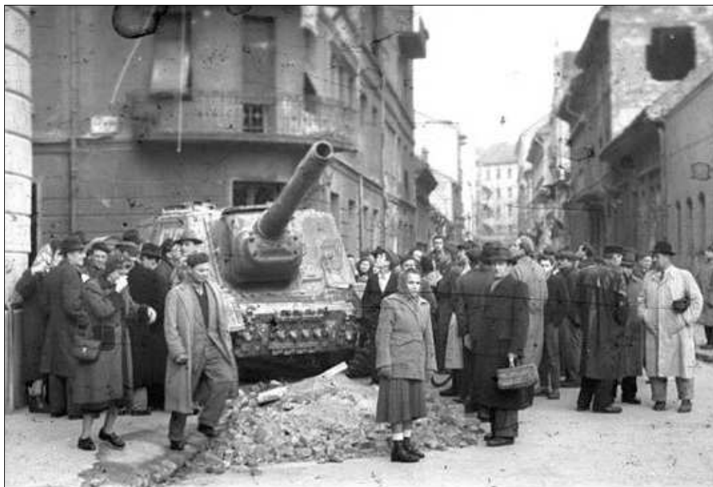
1956 -os forradalmi utcakép

A tüntetők megvadultak, és a féktelen düh hatására az ÁVH embereit kezdték keresni, meglincselve olyanokat is, akikre csak a gyanú árnyéka vetült. (A forradalom 20 napja alatt 28 embert vert halálra a