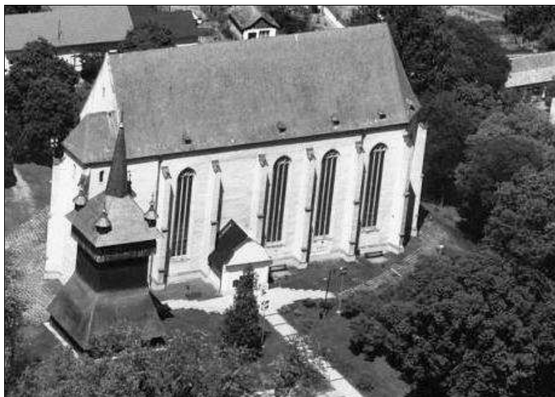
A nyírbátori református templom és harangláb