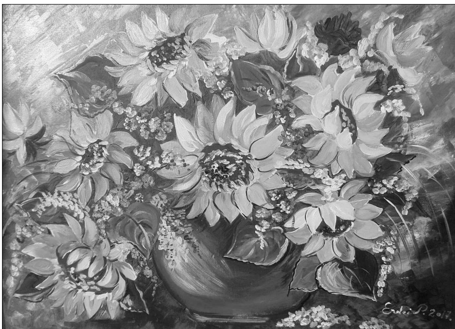
Erdi Piroska festménye

Ilyen és ehhez hasonló gondolatok kavalkádja cikázott a fejemben, amikor hirtelen megrémültem. Ránéztem a testvéremre, és egy furcsa érzés kerített hatalmába. A hugicám már nem is olyan kicsi. Folyamatosan változik, és eddig észre sem vettem, hogy mennyire más lett. Mi történt ilyen hirtelen? Az embert a felismerés sokszor megrémíti. Az, ha valaki