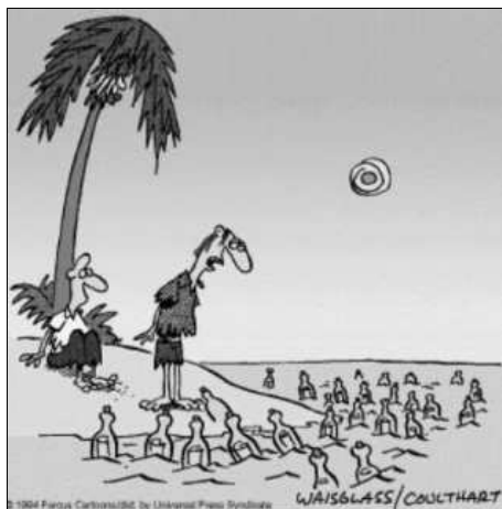
Felkerülhettünk valami rohadt levelezőlistára...

– Szívesen, fiam – mondja az autós –, de hogy kapja meg ott?