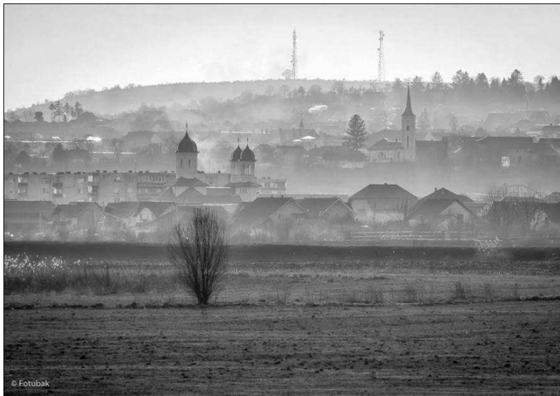
Fotó: Balázs Csaba