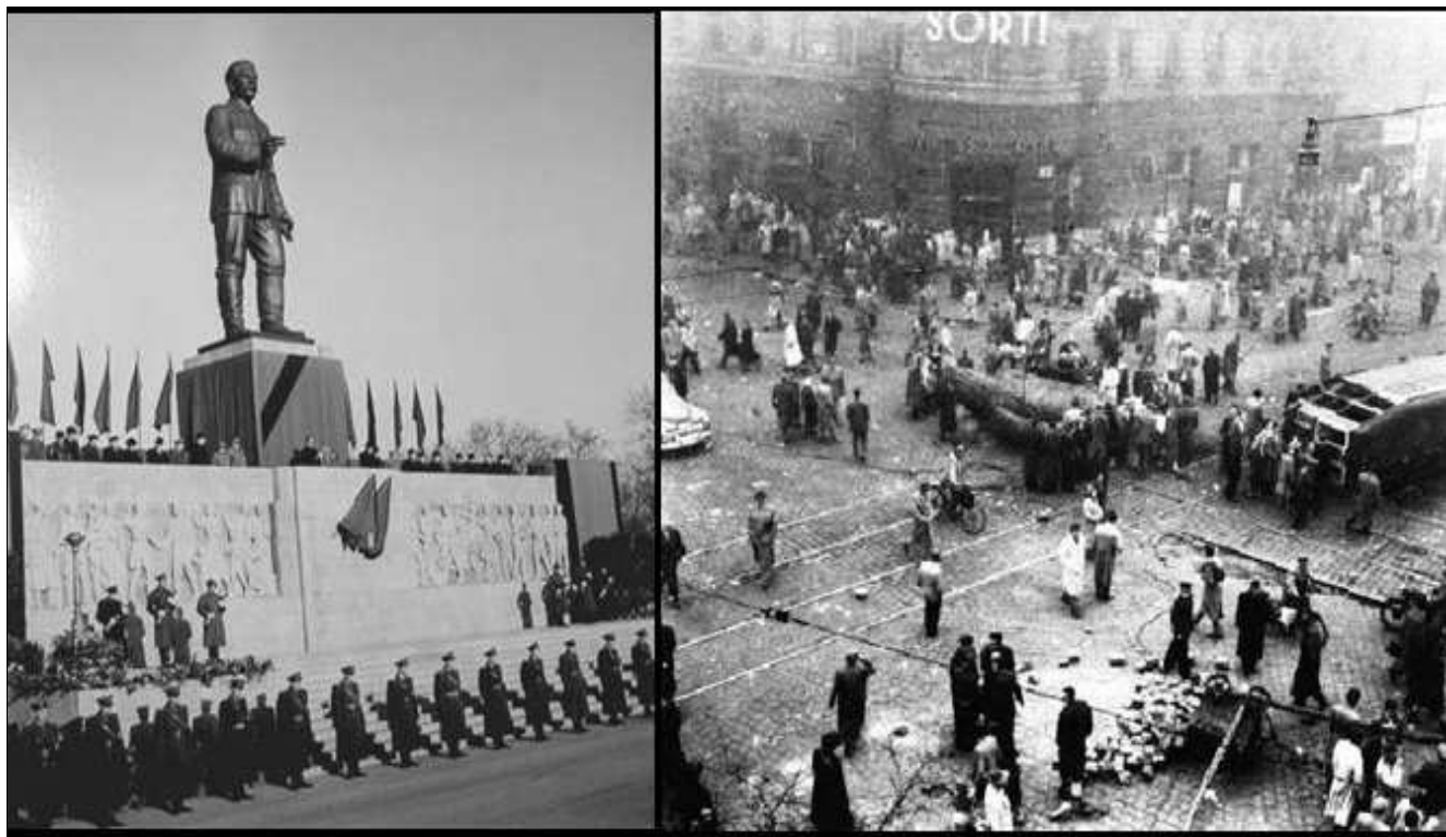
A Sztálin-szobor fénykorában és ledöntve 1956-ban