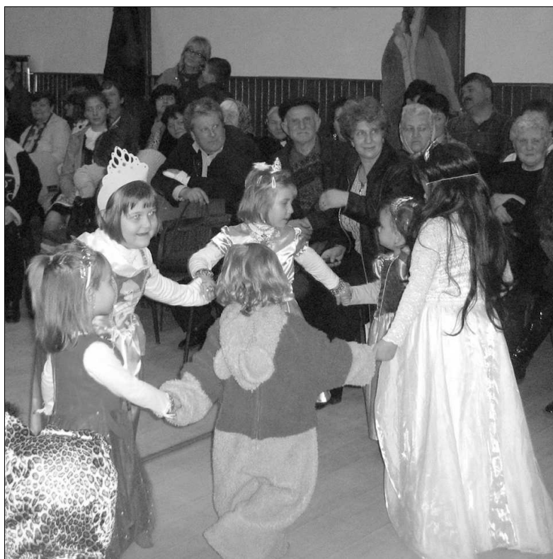
Kinőnek majd a szárnyak

Vekerdy Tamás, Popper Péter, Ranschburg Jenő pszichológusok óta nagyon tudjuk, mire van szüksége a kisgyerekeknek: lehető legközelebbi, lehető legkisebb létszámú iskolákra, mindenekelőtt érzelmi biztonságra, sok szabadban töltött időre, kötetlen, szabad játékra, fára mászásra, hócsatákra. Azonkívül otthon meseolvasásra, értő, odafigyelő szeretetre, következetes, jó szülői példákra épülő nevelésre. Bizony, ezek a roppant egyszerű, nagyon is kéznél levő dolgok –