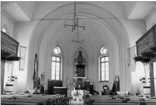
A templom belseje