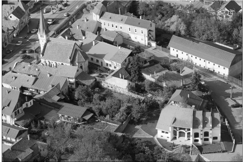
A református templom és a DIO Ház