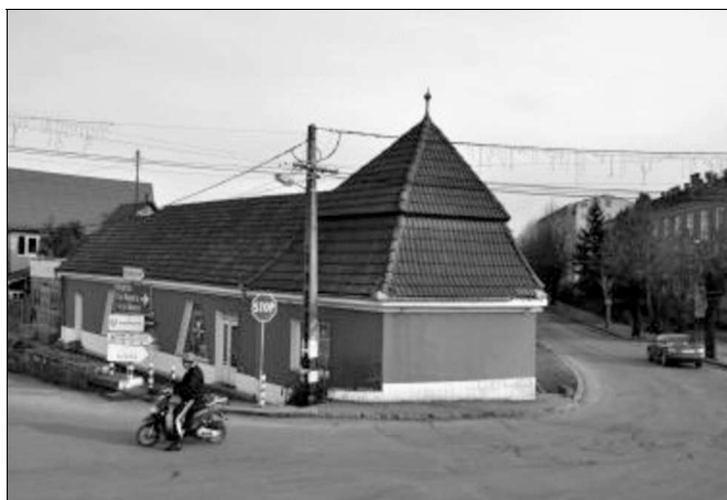
Az Axente Sever utca