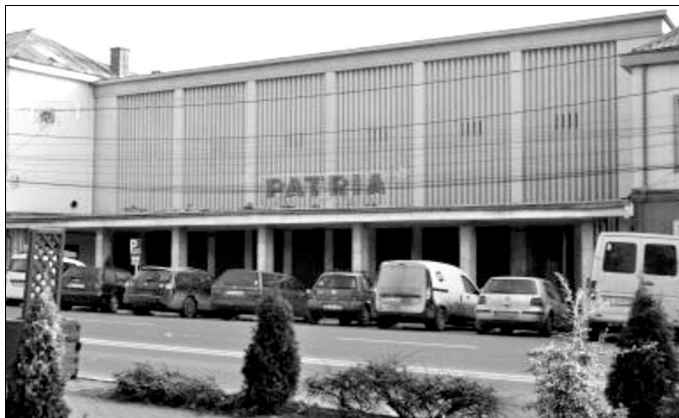
A volt Patria mozi

Egy, a helyi tanács által a közbiztonság erősítése érdekében jóváhagyott határozattervezet alapján a polgármesteri hivatal hozzáfogott térfigyelő kamerák felszereléséhez a városban. Eddig 70 működik útkezesztődéseknél, a központban több helyen, és azokban a városrészekben, amelyekről több panasz érkezett korábban a közbiztonsággal kapcsolatban. Így például hét kamera figyeli Abafája környékét. A rendszer igen hatékony, többször sikerült tolvajt kézre ke-