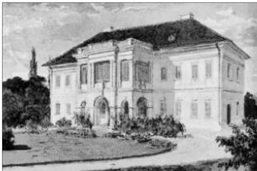
Valamikor réges régen

Kevesen tudják talán, hogy Szászrégen mellett, Abafáján (néhány évtizede közigazgatásilag is a vá- roshoz tartozik) áll az egykori Huszár-kastély. A mai állapota szerint nemsokára már csak az emléke ma- rad fenn az egykori klasszicista stílusú kastélynak, amelynek lakói és látogatói között olyan neves szemé- lyiségek voltak, mint például zágoni Mikes Kelemen, aki gyermekkorra egy részét töltötte ott, hiszen anyja, Torma Éva volt a birtokosa mint a brenhidai Huszár család leszármazottja. Ott született Bethlen Gergely honvédezedes, ott vendégeskedett 1901-ben Habs- burg Károly főherceg, az utolsó magyar király, és ott tartózkodott 1905-ben az első miséje után báró Apos