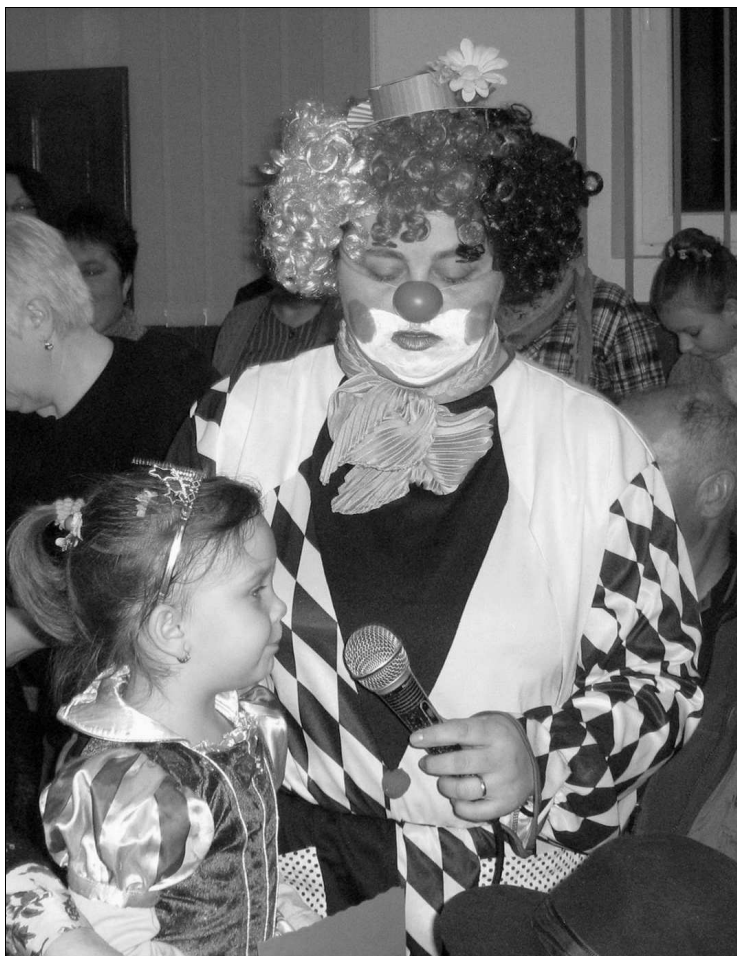
Mi lesz veled, emberke?

Tehát a folyamat réges-régen elindult. És akkor erre rájön a VÁROS. Így, csupa nagybetűvel. Ott is kevés a gyerek, iskolák szűnnek