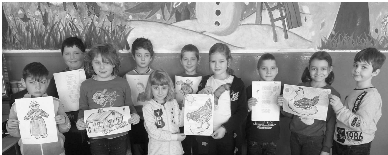
Voltak, akik rajzokat készítettek