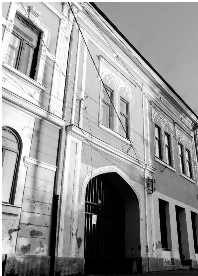
A Magyar Polgári Dal- és Olvasókör