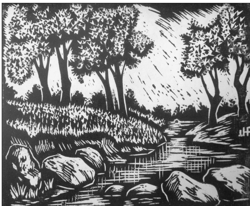
Április – ifj. Jorga Ferenc metszete

Először sírsz. Azután átkozódsz. Aztán imádkozol. Aztán megfeszíted Körömszakadtig maradék- erőd. Akarsz, egetostromló akarat- tal – S a lehetetlenség konok falán Zúzod véresre koponyád. Azután elalélsz. S ha újra eszmélsz, mindent újra kezdesz. Utoljára is tompa kábulattal, Szótalanul, gondolattalanul Mondod magadnak: mindegy, mindhiába: A bűn, a betegség, a nyomorúság, A mindennapi szörnyű szürkesség Tömlőcéből nincsen, nincsen menekvés! S akkor – magától – megnyílik az ég, Mely nem tárult ki átokra, imára, Erő, akarat, kétségbeesés, Bűnbánat – hasztalanul ostro- molták. Akkor megnyílik magától az ég, S egy kicsi csillag sétál szembe véled, S olyan közel jön, szépen mosolyogva, Hogy azt hiszed: a tenyeredbe hull. Akkor – magától – szűnik a vihar, Akkor – magától – minden elcsitul, Akkor – magától – éled a remény. Álomfáidnak minden aranyágán Csak úgy magától – friss gyümölcs terem. Ez a magától: ez a Kegelem.