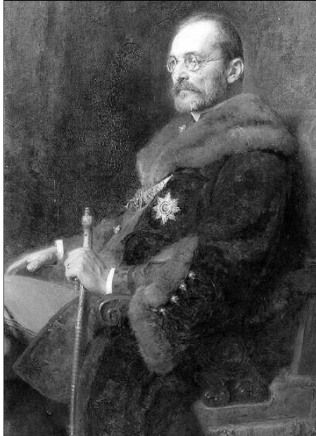
Gróf Tisza István

„Tisza az ezredhez történt bevonulásának már első napjaiban érzekelte az őt körülvevő, nem éppen barátságos légkört, és először közvetlen magatartással próbálta oldani a hangulatot. (...) Kezdetől fogva törekedett rá, hogy közvetlen hangot üssön meg mind a tisztikarral, mind pedig – természetesen a szolgálati szabályzat keretein belül – a legénységgel. Hogy jobban megismerjék egymást tisztársaival, minden nap meghívott saját asztalához néhány fiatal tisztet, ezáltal igyekezett minél több személyes kapcsolatot kialakítani környezetében. A legénység lassan kezdte őt felfelé kemény, lefelé pedig emberséges parancsnoknak megismerni. A dohányilletményét a tiszték között osztotta ki, saját parancsnoki zsoldját pedig a legénység ételmezésének feljavítására fordította, s ez természetesen