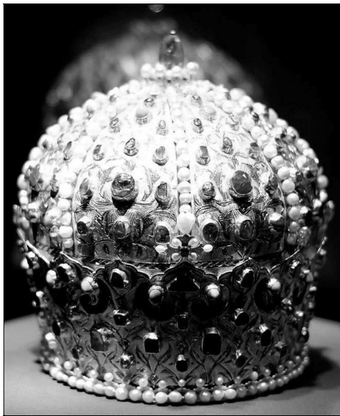
Bocskai István koronája

Az első világháború után felbomlott az Osztrák–Magyar Monarchia. Az utódállamok közül, meglepő módon, a román állam azzal fordult Ausztriához, hogy szolgáltassa ki számára a koronát, arra