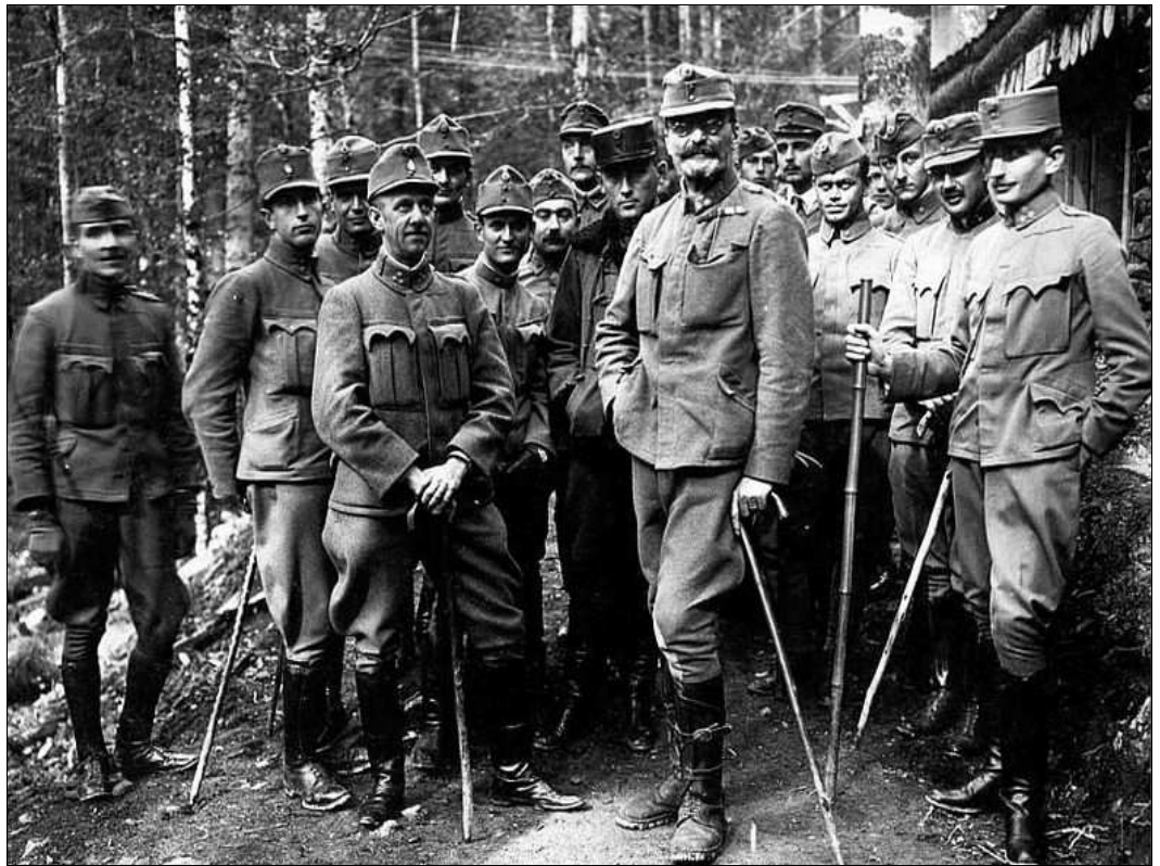
Az olasz fronton 1917-ben

Napközben a külső Hermina úton, a villa tájékán sűrű tömeg verődött össze. Este egynegyed hét óra tájban nyolc baka átmászott a magas vasrácsos kerítésen és a kert pázsitján át a házhoz lopózkodott. A hátul-só ajtón mentek be. A Tisza István őrizetére rendelt