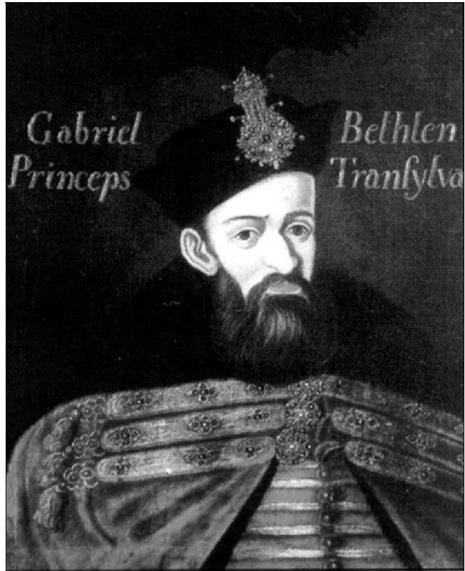
Bethlen Gábor fejedelem

A harmincéves háború 1618 májusában a Habsburg-ellenes cseh felkeléssel kezdődött. A cseh felkelők Bethlen Gábortól kértek segítséget, és ennek fejében a cseh koronát is megígérték. Bethlen hadvezéré, Rákóczi Györgyöt értesíti a csehországi fejleményekről: „...a csehek semmiben az magyar nemzetől különbözni nem akarnak, örömet együtt élnek-halnak vélek, sőt arra ígérték magukat levelükben, hogy valakit az magyar nemzet királyának választ, ők