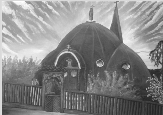
Radnótfáji róm. kat. templom – Simon Zsuzsa (17 éves) munkája –