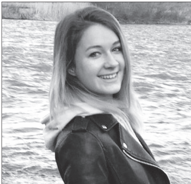
Átéltam ezt az óisszeszt is

A hosszas felkészülés után végül elérkezik a más-más megmérettetés napja. Ez sem szokott zökkenőmentesen zajlani. Ilyenkor az atsimetegyének a legnagyobb félelme az, hogy a megmérettetés közepette megszakad a mágikus erővel való kapcsolat. Ezenkívül a tudás felmérése általában 2-3 óráig tart, amikor megpróbál mindent a legjobb tudása szerint megoldani. Minden egyes megmérettetés után a kéjital és az energiasugárzó szen-