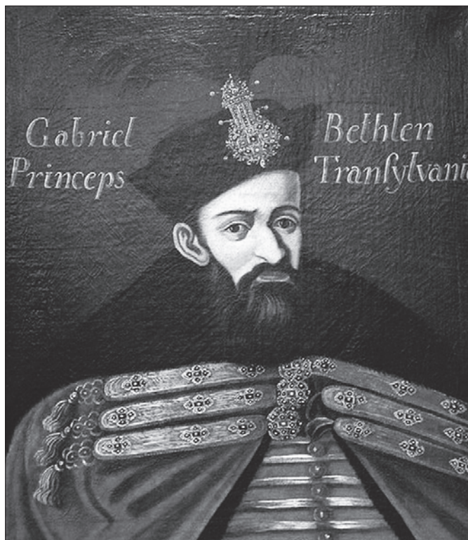
Bethlen Gábor fejedelem

Kemény János Erdély virágkoráról ír, de előrevetíti