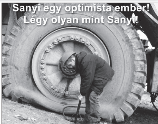
Sanyi egy optimista ember! Légy olyan mint Sanyi!