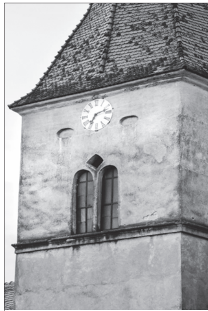
Az abafáji római katolikus templom